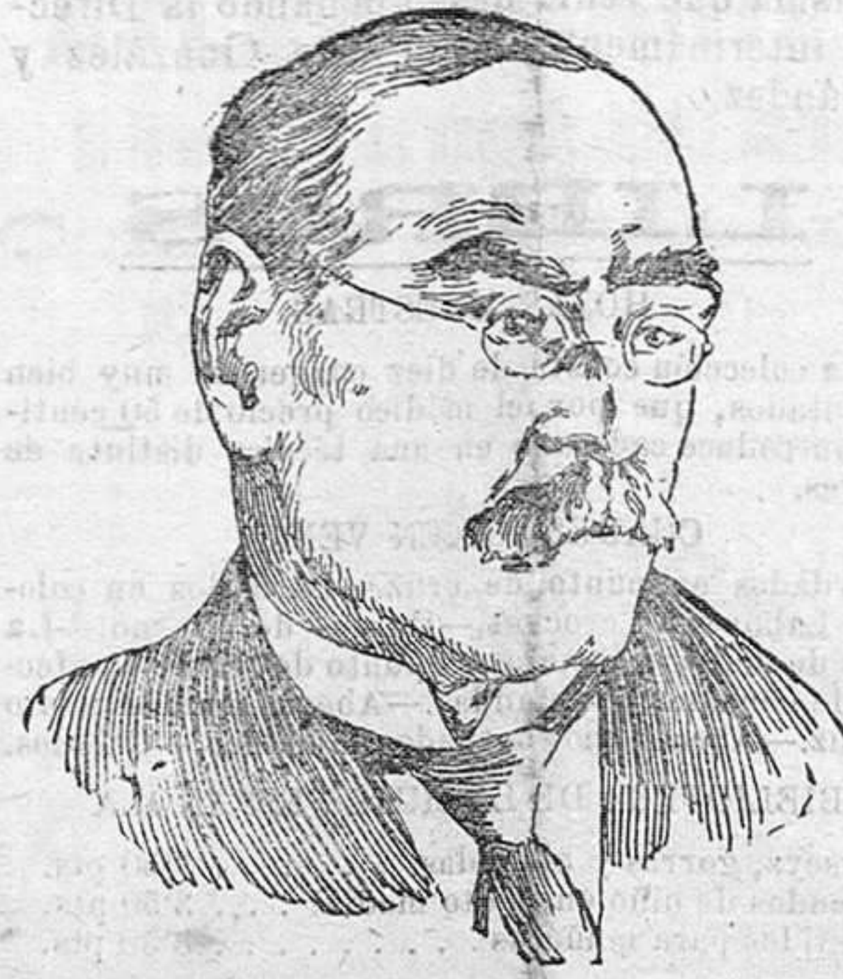
El célebre poeta imperialista inglés, Mr. Rudyard Kipling, que se encuentra en Madrid.