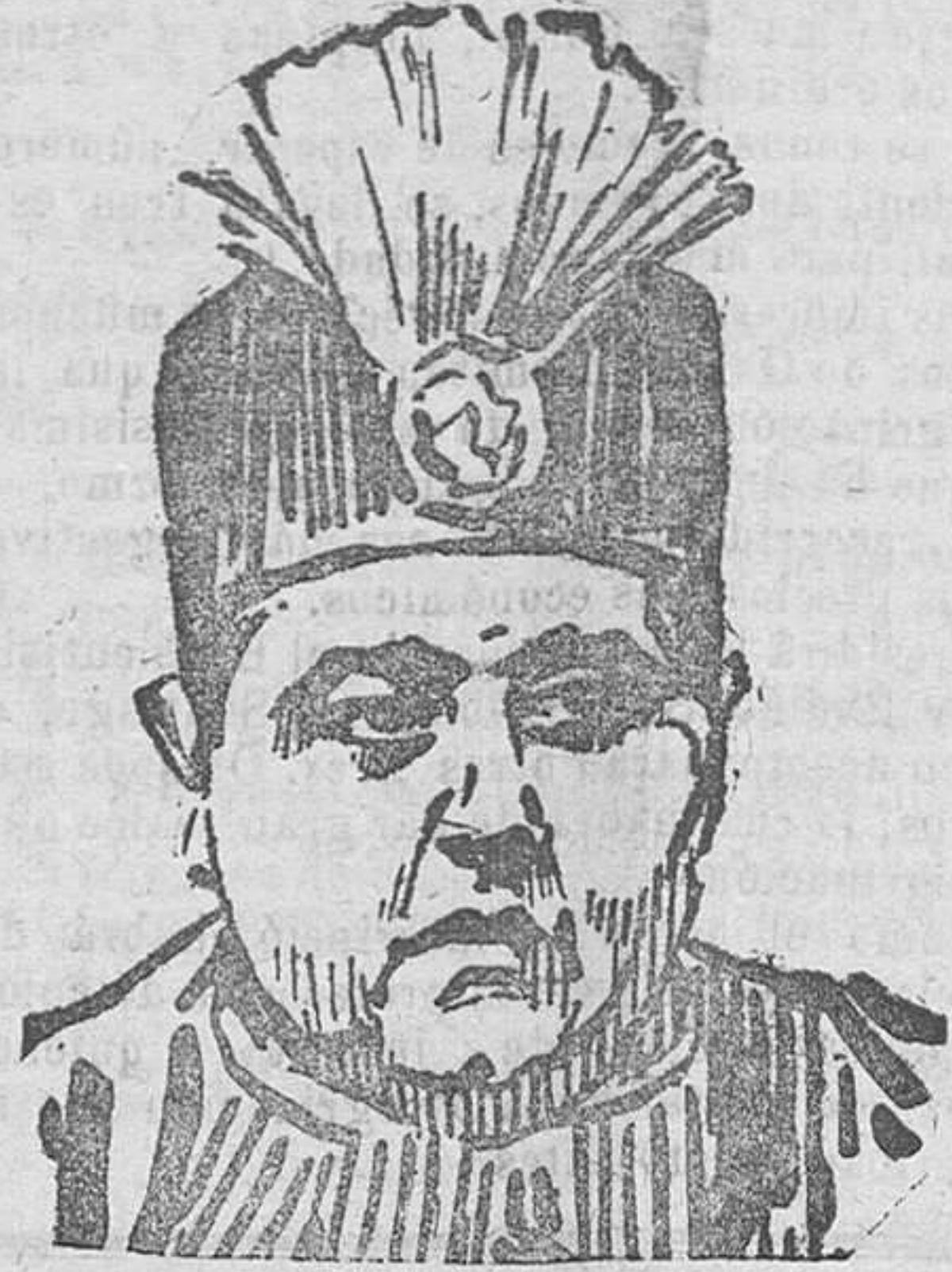
El Sahah de Persia Amed-Chad-Radjar que ha sido conminado por el general Resa Kan para regresar a su país o abdicar el trono.

el ilustre senador de Delaware haya propuesto de bonísima buena fe el que titula «matrimonio de ensayo». Los novios se casan «por un año». Al cabo de doce meses de observaciones mutuas, o se separan, si es su gusto, o se casan «en serio» para toda la vida, sin derecho a ulteriores divorcios.