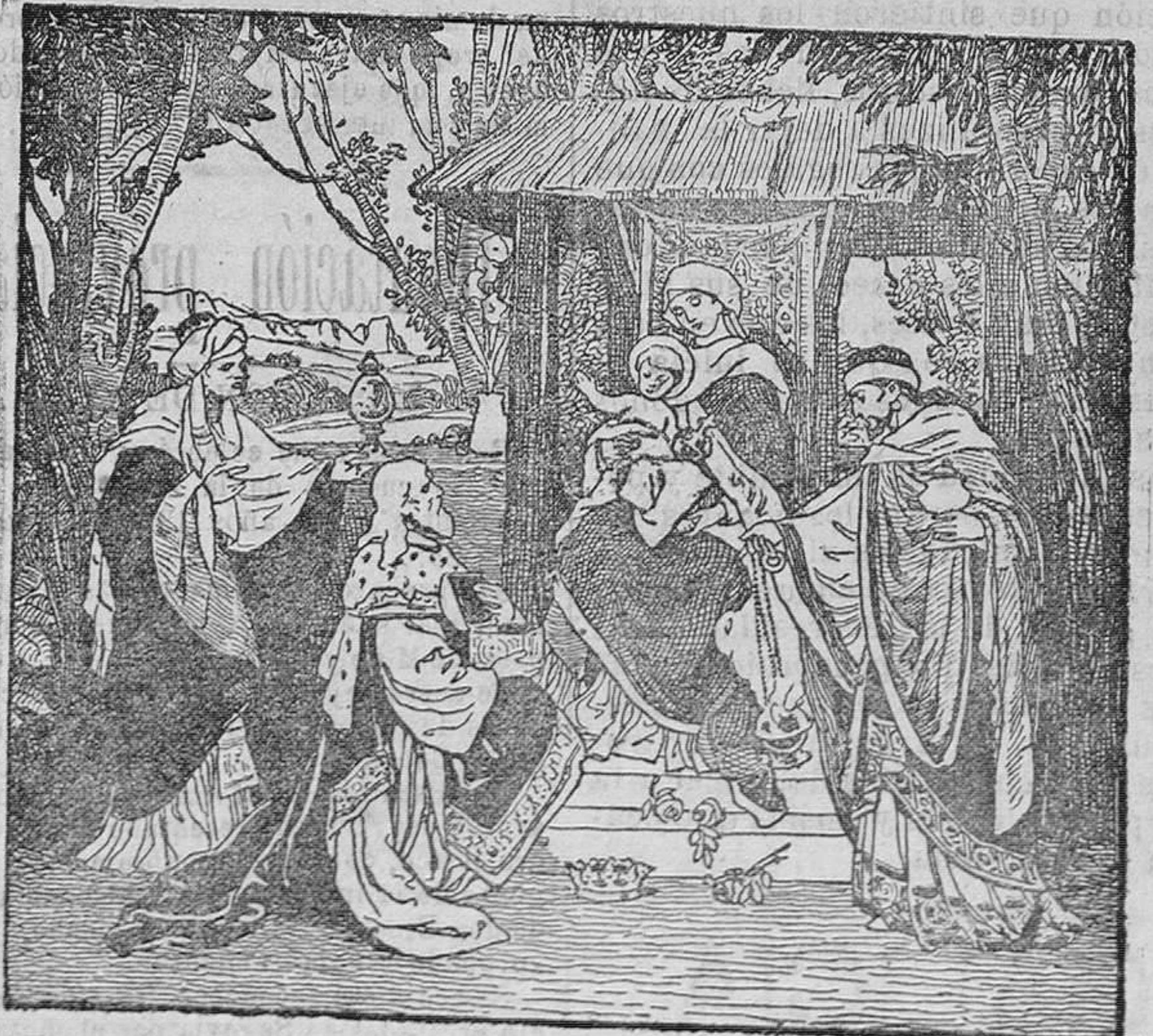
La adoración de los Santos Reyes