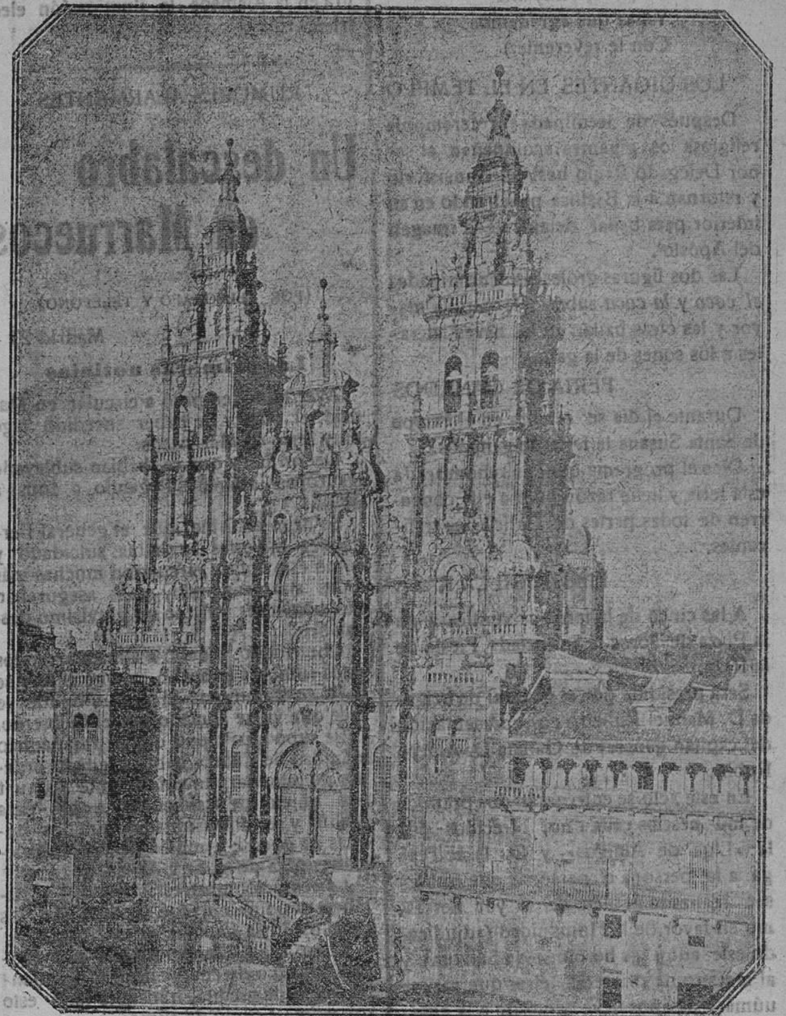
La Catedral de Santiago.—Fachada del Obradoiro

Llegado el Ofertorio, después de haber hecho su ofrenda en manos del Eminentísimo Prelado los Sres. capitulares asistentes, los del coro y Beneficiados, e