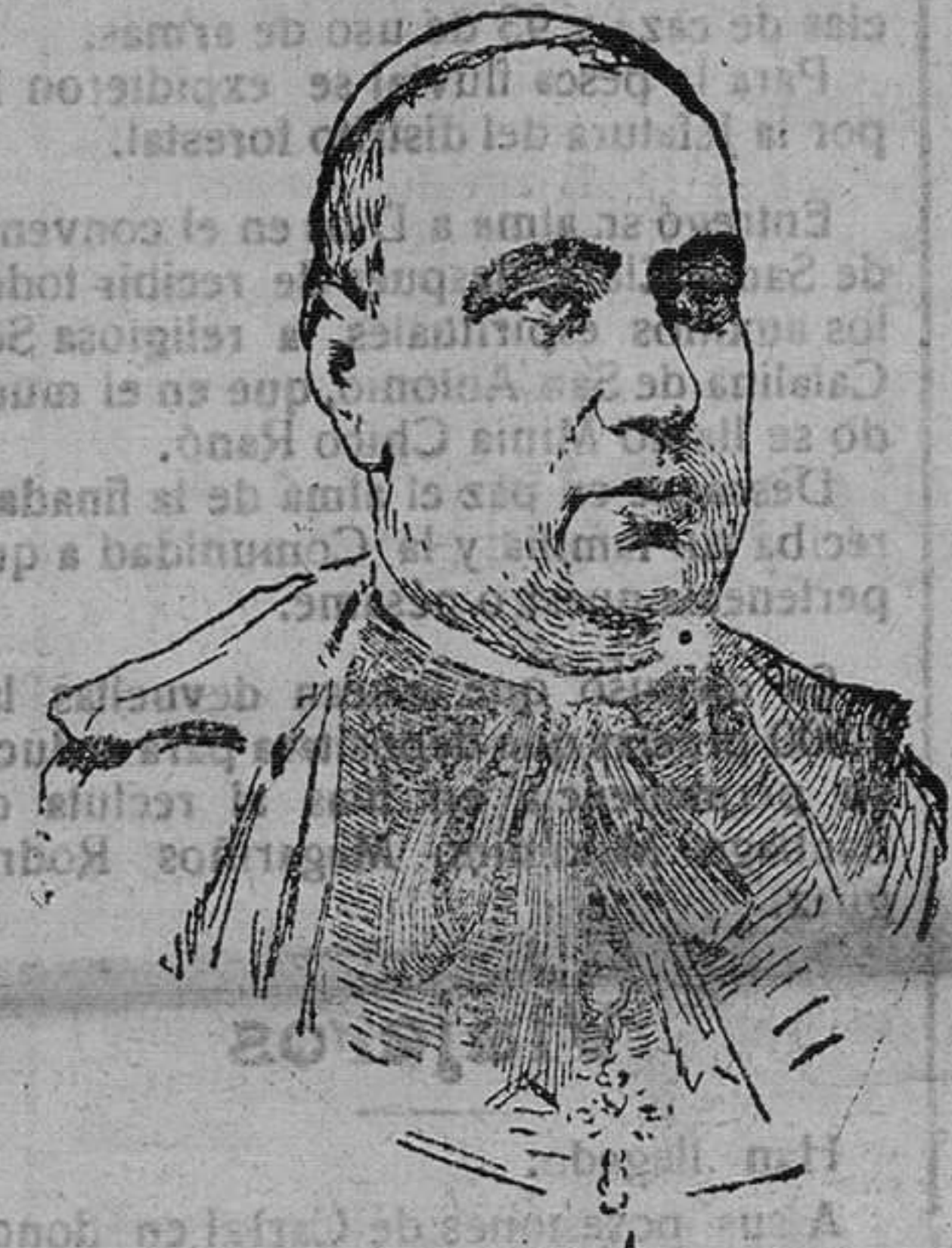
El cardenal Almaraz y Santos, primado de España, que con gran pompa ha hecho su entrada, el domingo último en Toledo.