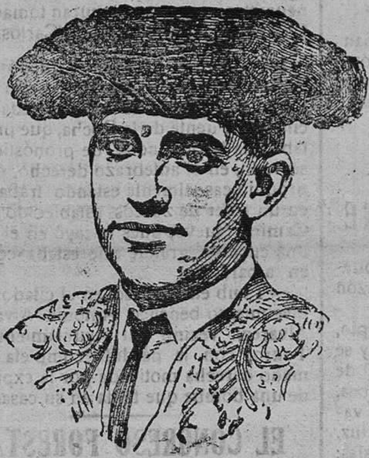
El famoso torero Juan Belmonte, que acaba de sufrir una difícil operación a causa de la fractura de la mandíbula que se produjo en la plaza de Sevilla.