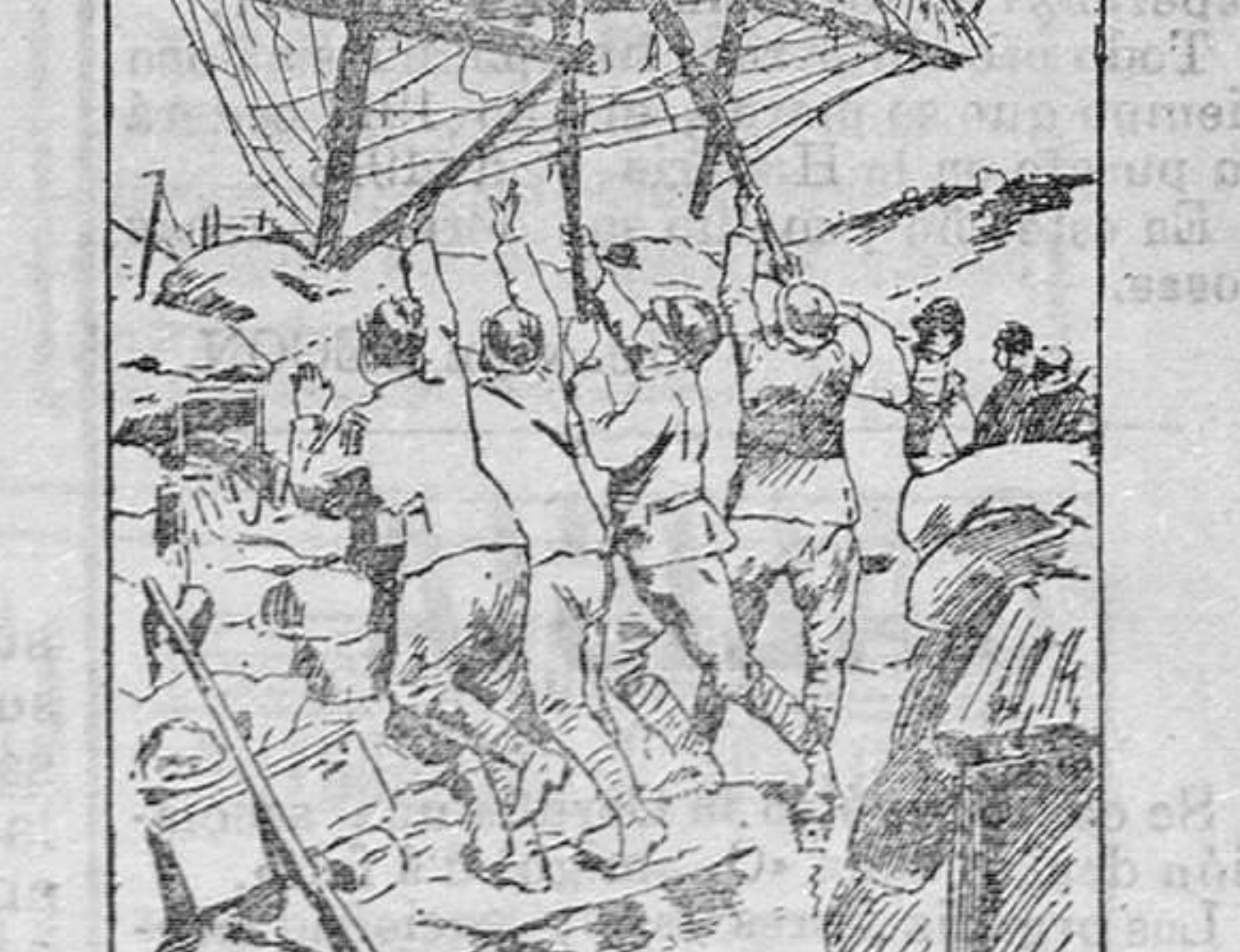
Consolidando una posición por medio de alambres.

En el resto de la campaña, las posiciones continuaron siendo sensiblemente las mismas. Veamos ahora como se ha desarrollado la ofensiva austriaca.