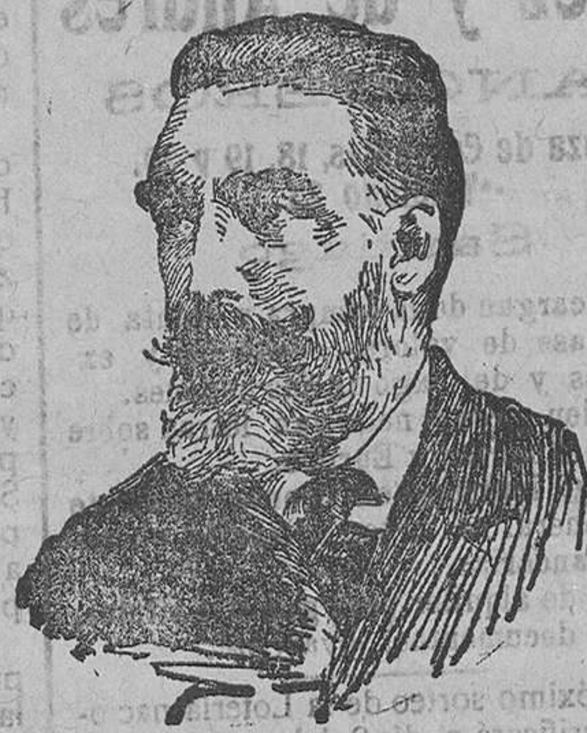
Portrait of a man, likely the author or a key figure mentioned in the text.

Unos minutos antes de las cuatro, la primera escuadra de batalla, guiada por el «Revenge», buque insignia del vicealmirante Madden, se puso en movimiento. Los buques navegaban uno tras otro