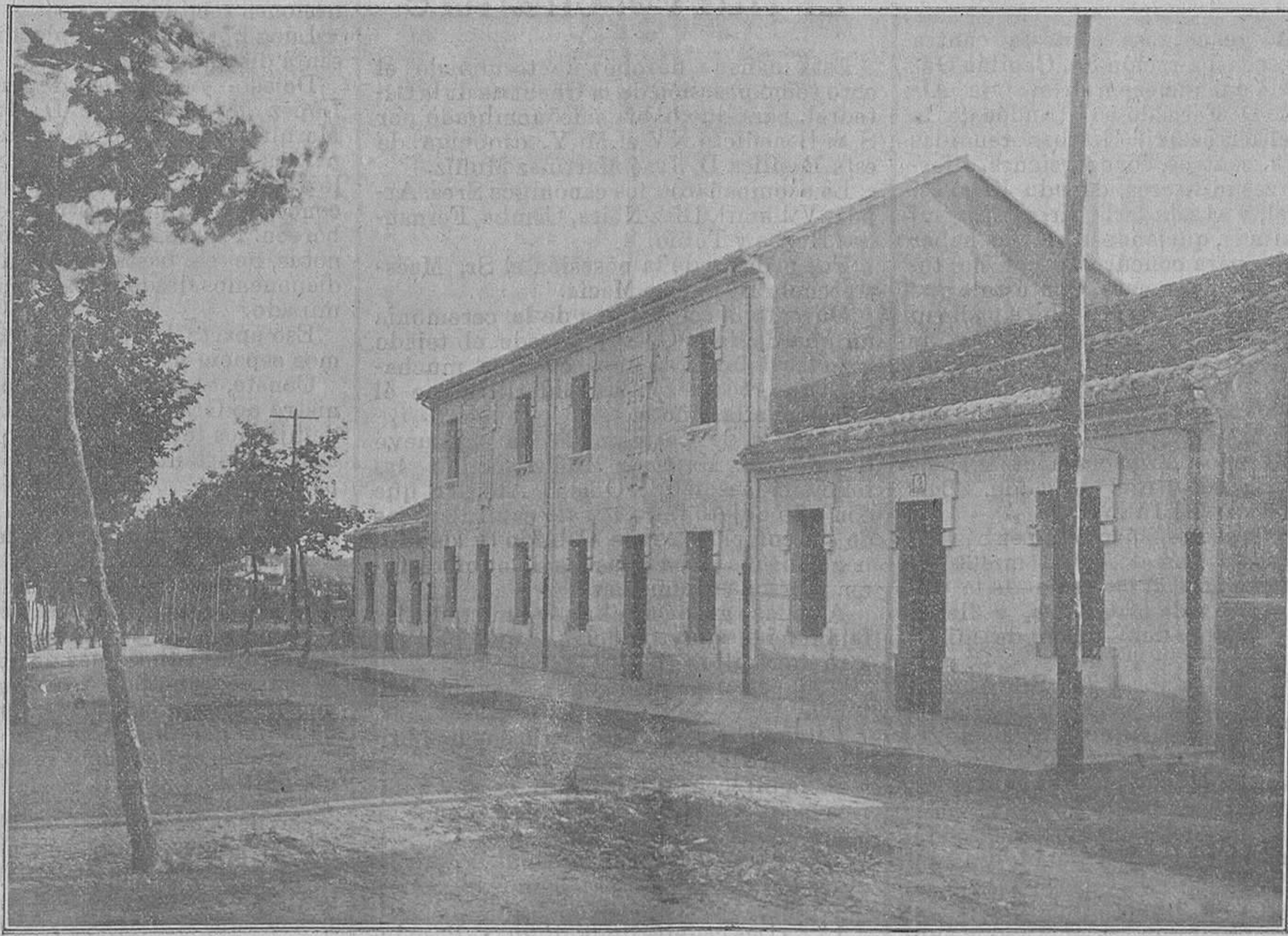
Las casas baratas inauguradas ayer construidas por la Caja de Ahorros

Como instituciones benéficas, las Cajas, han prestado y continúan prestando grandes y positivos servicios no bien apreciados tal vez por el pueblo que los utiliza, librando de las garras y asechanzas de la usura y de la miseria a las clases necesitadas y estimulando la economía que enciende la virtud del ahorro y reconcentra en la intimidad del hogar la vida de familia, ante la alhagadora perspectiva de que la gota que se sustrae al gasto de la semana, llegará a formar un canal de consuelos y esperanzas que atense, al menos, las amarguras de una crisis o las tristezas y pesadumbres de la vejez.