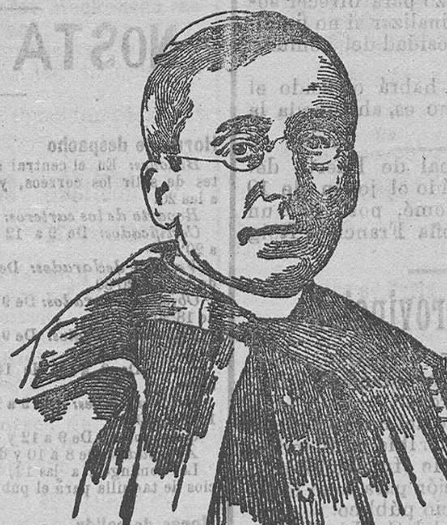
S. S. el Papa Benedicto XV

Escucho encantado la palabra persuasiva y cariñosa, sinceramente afable, del Santo Padre, y no me atrevo a despegar los labios por no romper el encanto... Su Santidad me habla en seguida de la Prensa española; se informa de las tendencias políticas de los diarios más importantes, y nuevamente evoca sus recuerdos... Si evoca los recuerdos de su estancia en Madrid, sin disimular el placer de esto le proporcione... ¡Hace treinta años! La visión de España vive unida al recuerdo de los años juveniles del Pontífice; las memorias de su juventud se funden con los nombres de las ciudades españolas que visitara... Por eso, sin duda complácese tanto hablando de su