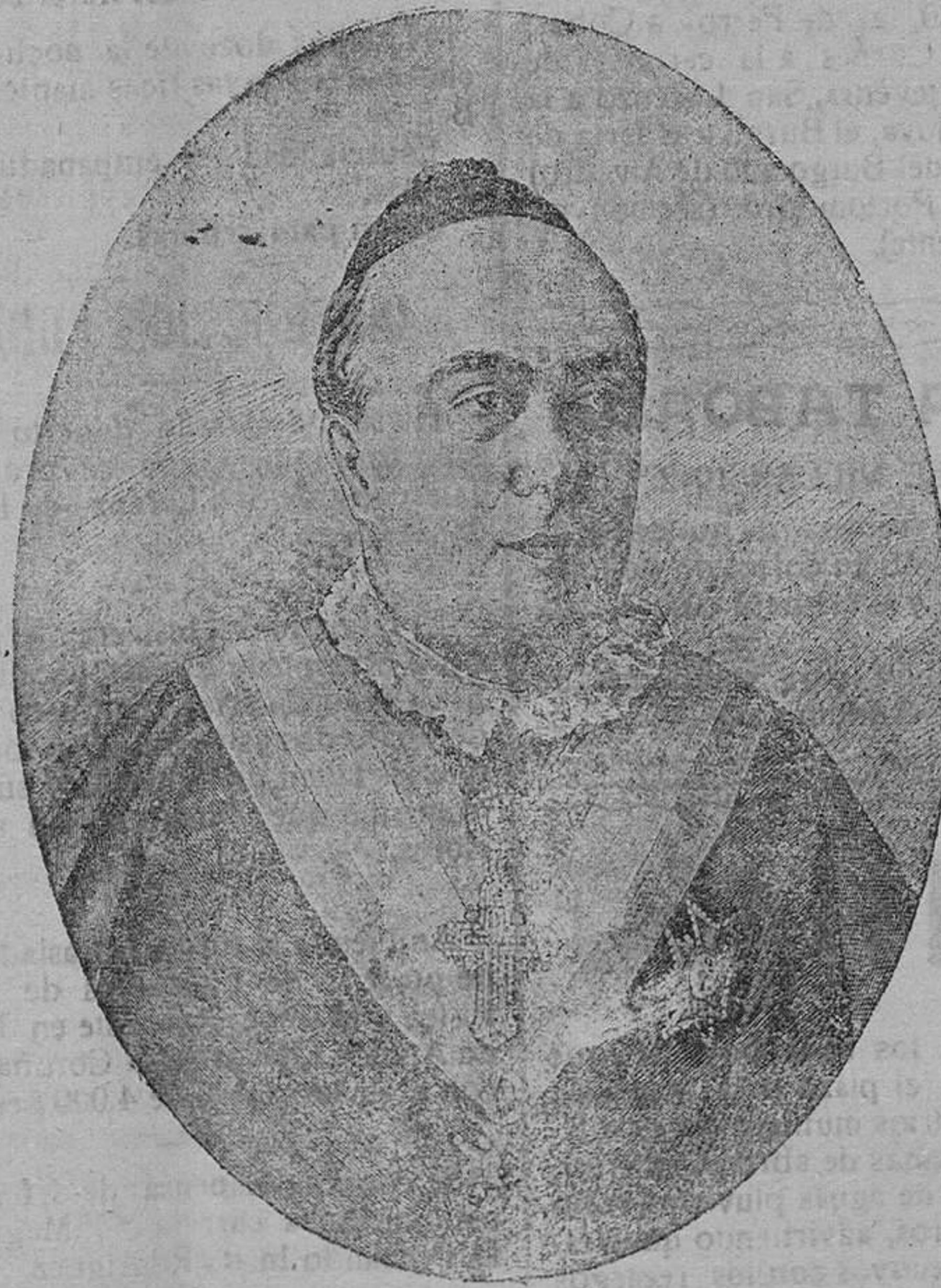
Emmo. y Revmo. Sr. Cardenal Arzobispo de Santiago.

Pero, el acto de hoy, tuvo una segunda parte que merece también el comentario del cronista. Después de terminada la peregrinación, cuando los habitantes de la ciudad se dispersaban por sus calles satisfechos de haber cumplido como fieles hijos de la Iglesia y amantes de las tradiciones compostelanas, las autoridades, la más alta y más genuina representación de la ciudad subió al Palacio Arzobispal y cumplimentó al señor Cardenal Arzobispo haciéndole presente sus más entusiastas parabienes porque Dios le permitió