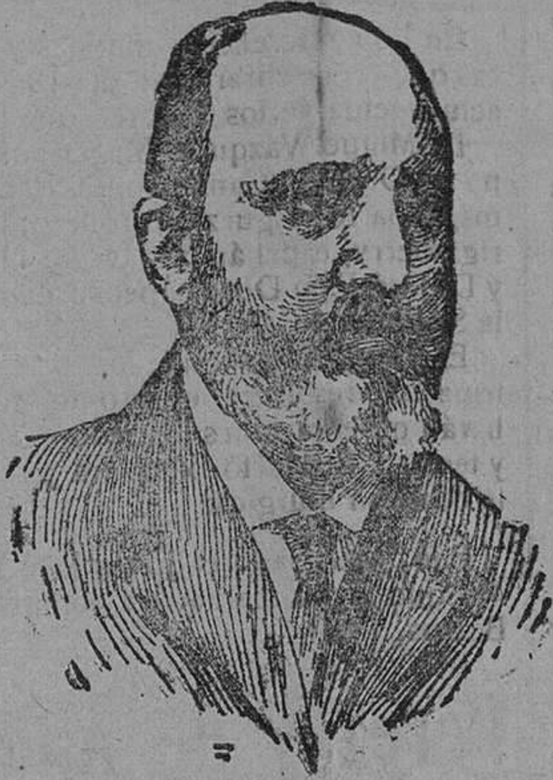
El ilustre ingeniero Torres Quevedo que ingresó ayer en la Academia Española pasando a ocupar el sillón de Pérez Galdós.