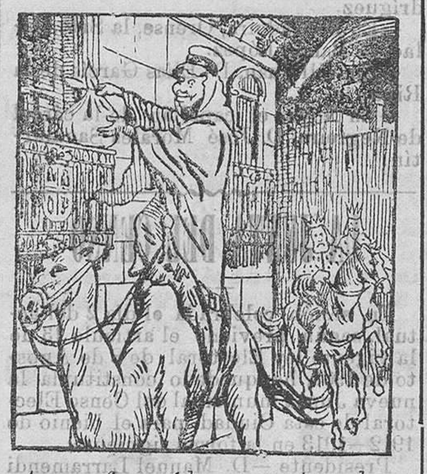
A perro flaco... ó lo que nos trae el rey moro. — Aquí este lío... ¡y divertirse.

Por eso seamos cautos; y al levantar cada día la hoja del papel, acordémonos que quizá vamos a descubrir la hoja de acero.