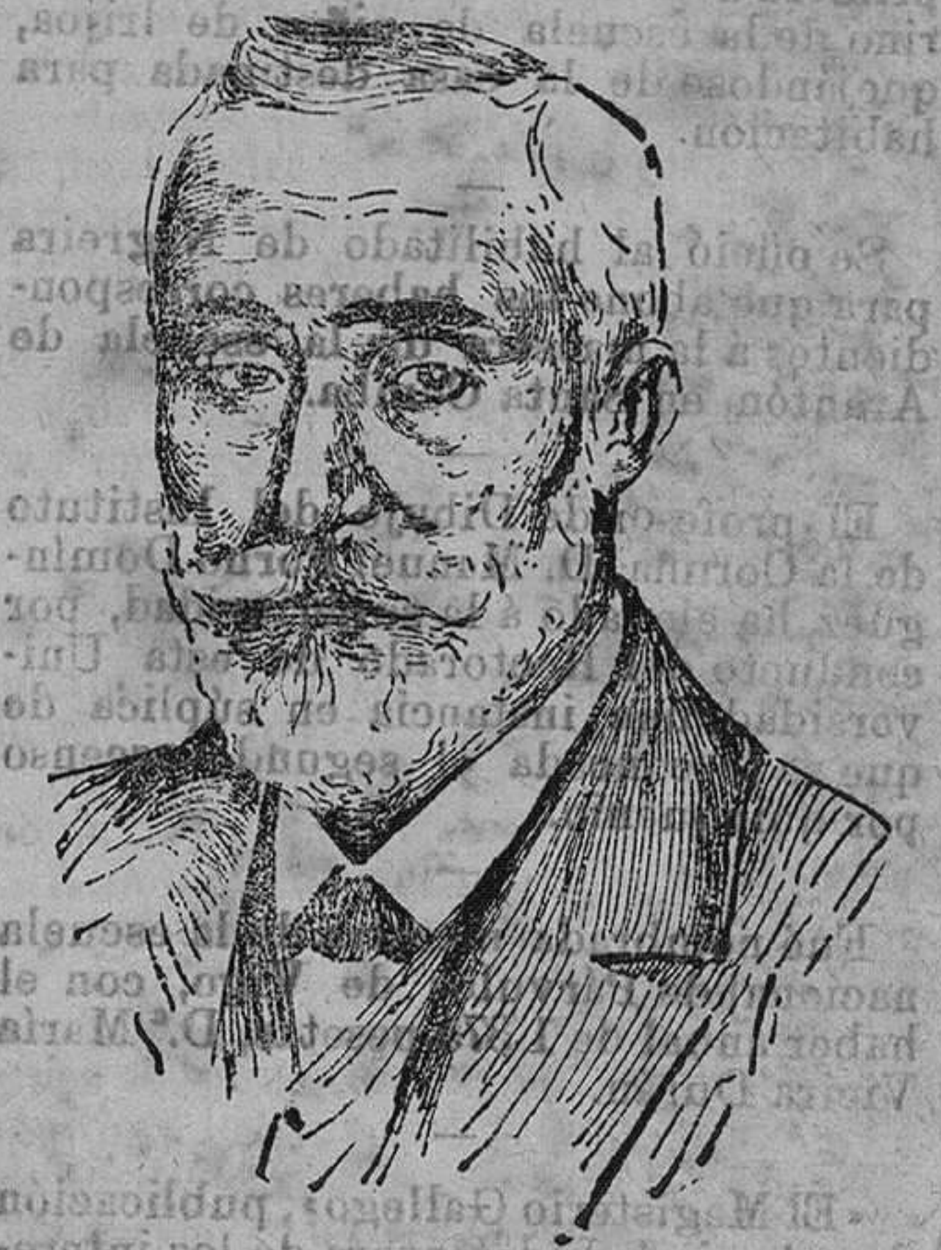
D. ANTONIO MAURA

Muy distinguido señor mío: Recibo con gratitud el homenaje que la «Juventud Conservadora de Santiago» me dirige. Dejando aparte—y en su justo valor estimada—la benevolencia personal de que me dan expresiva muestra, aplaudo y agradezco principalmente