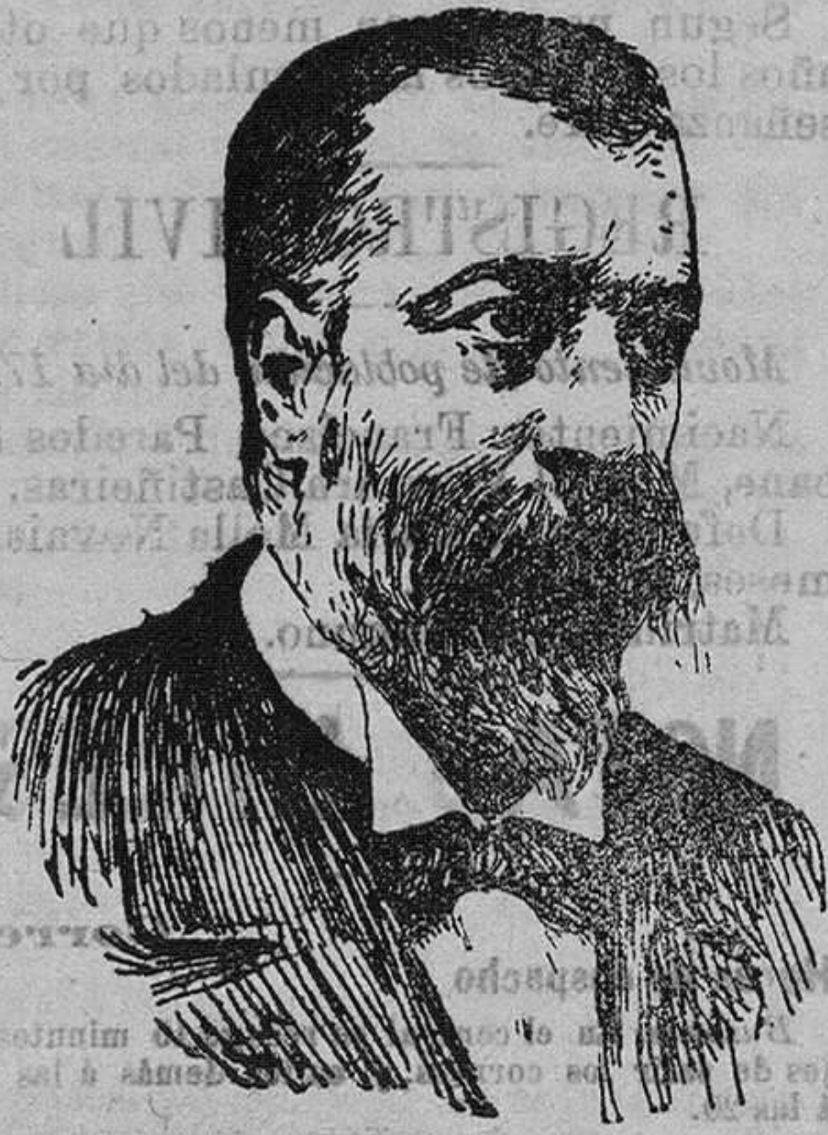
El Sr. Menéndez y Pelayo

Consecuencia y complemento del que sea y para que sirve la Historia es su misión en España materia que dilucida el docto académico tras unos párrafos de introducción destinados a mostrar por qué la Historia tiene que escribirse precisamente por los regnicolas, si ha de ser tal historia y no un tejido de prejuicios según accedió con la de España escrita desde fines del siglo XVIII por extranjeros de cuyos trabajos y efectos acertadamente escribe: «Agra-