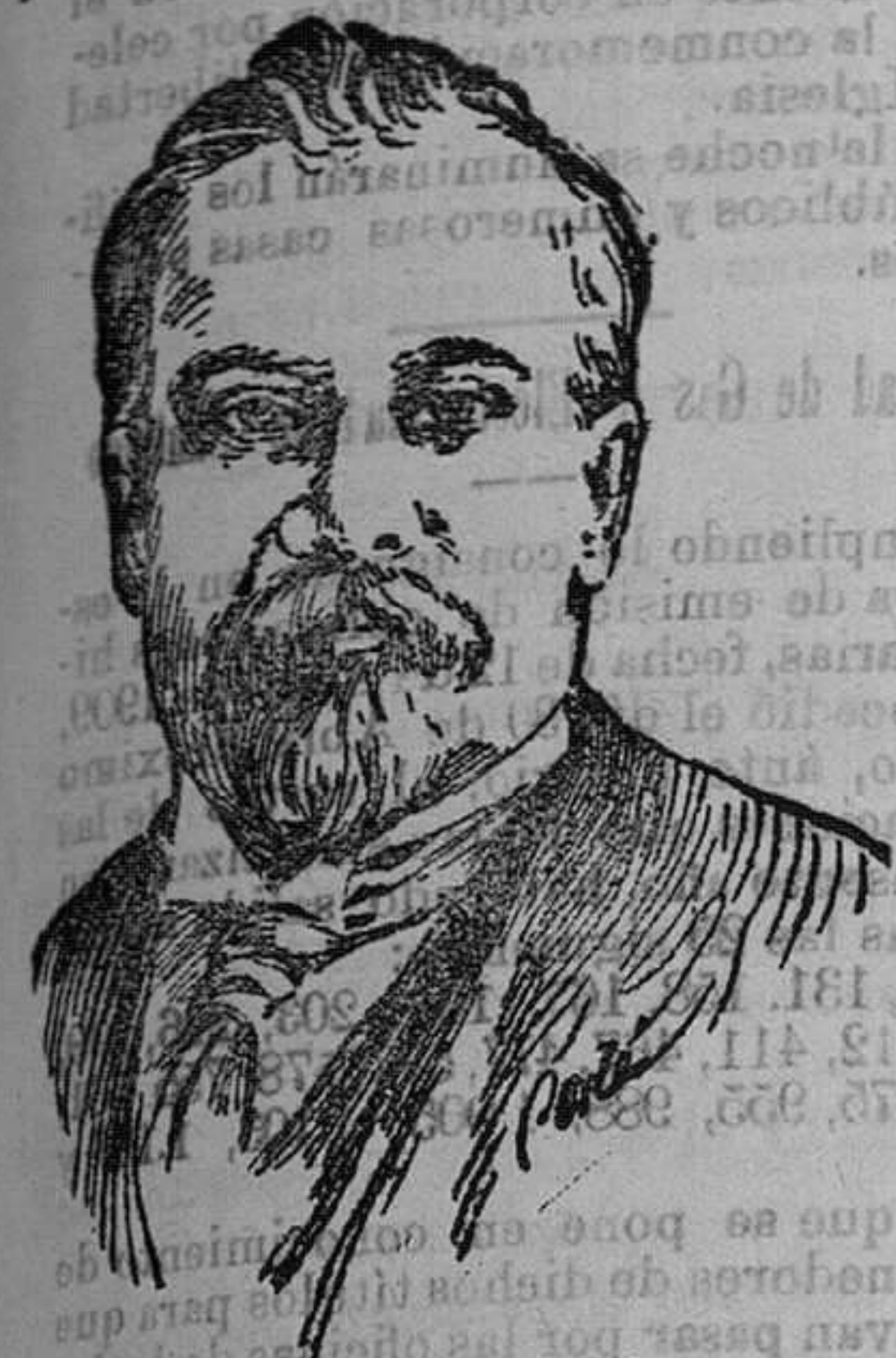
Mr. Poincaré, Presidente de la República francesa

En el banquete oficial que se celebró en el Eliseo, en honor del Rey de España, se pronunciaron los siguientes discursos: