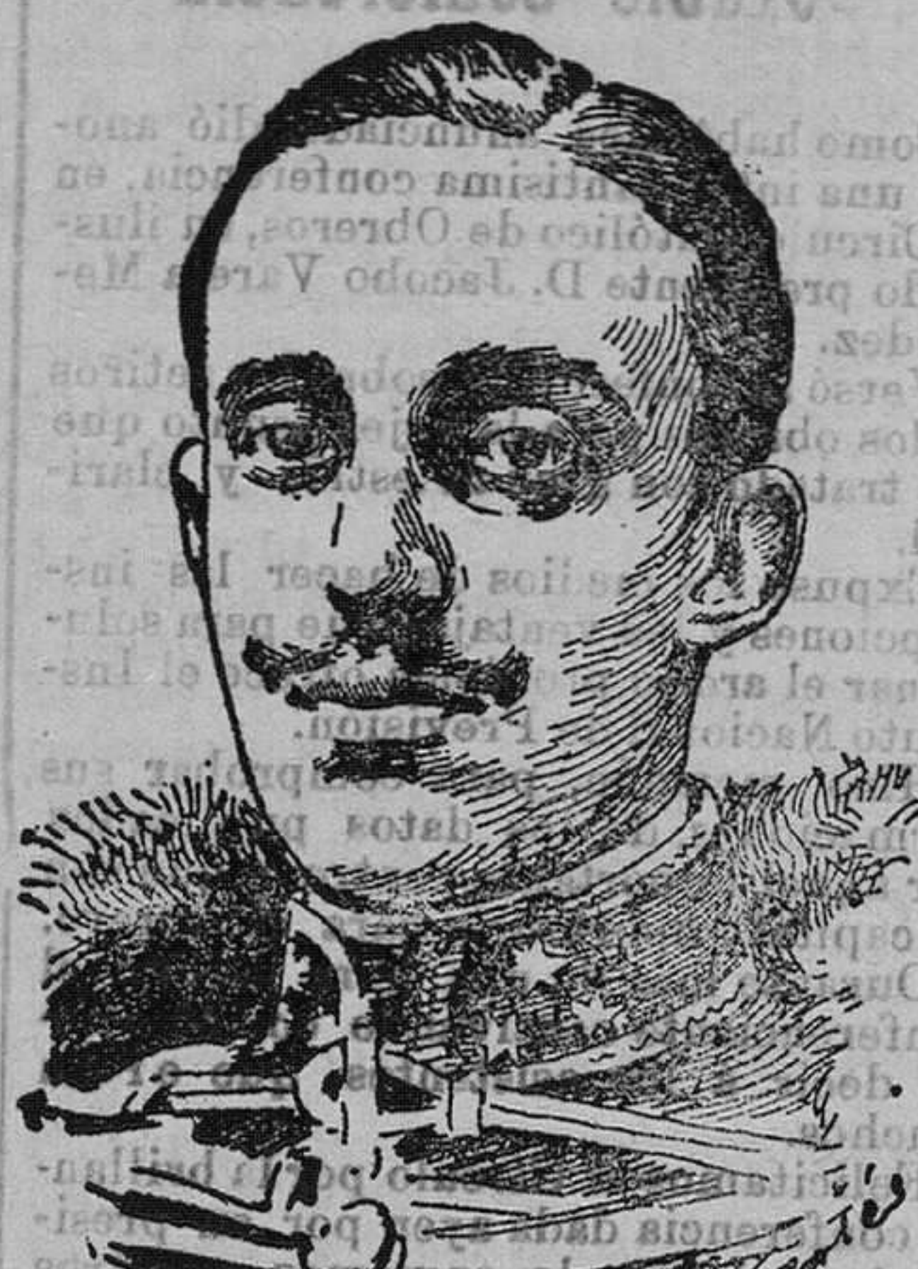
D. Alfonso XIII, Rey de España

SEÑOR: La Francia, que guarda agradecida la memoria de las dos últimas visitas de Vuestra Majestad, recuerda con emoción la simpatía que siempre le habéis demostrado. Siéntese dichosa de dar de nuevo la bienvenida a un Soberano que supo encantarla por su lealtad, su afabilidad y su valor. En él saludó a la noble nación que dio a la historia tantas páginas gloriosas y ha ofrecido al mundo tantos ejemplos de hidalgía. Me felicito particularmente de recibir a V. M. después del voto unánime, por el que las Asambleas de nuestros dos países han dado su aprobación a nuestro acuerdo marroquí. Las largas y corteses negociaciones que han tenido por término los recientes Convenios, habrían preparado, si hubiera sido necesario, a España y Francia a mejor conocerse y apreciarse. No fué ayer cuando las dos grandes naciones vecinas comprendieron la estrecha solidaridad de sus intereses y las razones permanentes de su amistad tradicional. Pero al colaborar de aquí en adelante, con una mutua confianza, en una obra de civilización y de paz, verán más claro que nunca, en su vecindad, una lección de la Naturaleza, y, en su parentesco, la ley de sus destinos. Alzo mi copa en honor de V. M., de Su Majestad la Reina y del Príncipe de Asturias. Bebo a la prosperidad y grandeza de España.