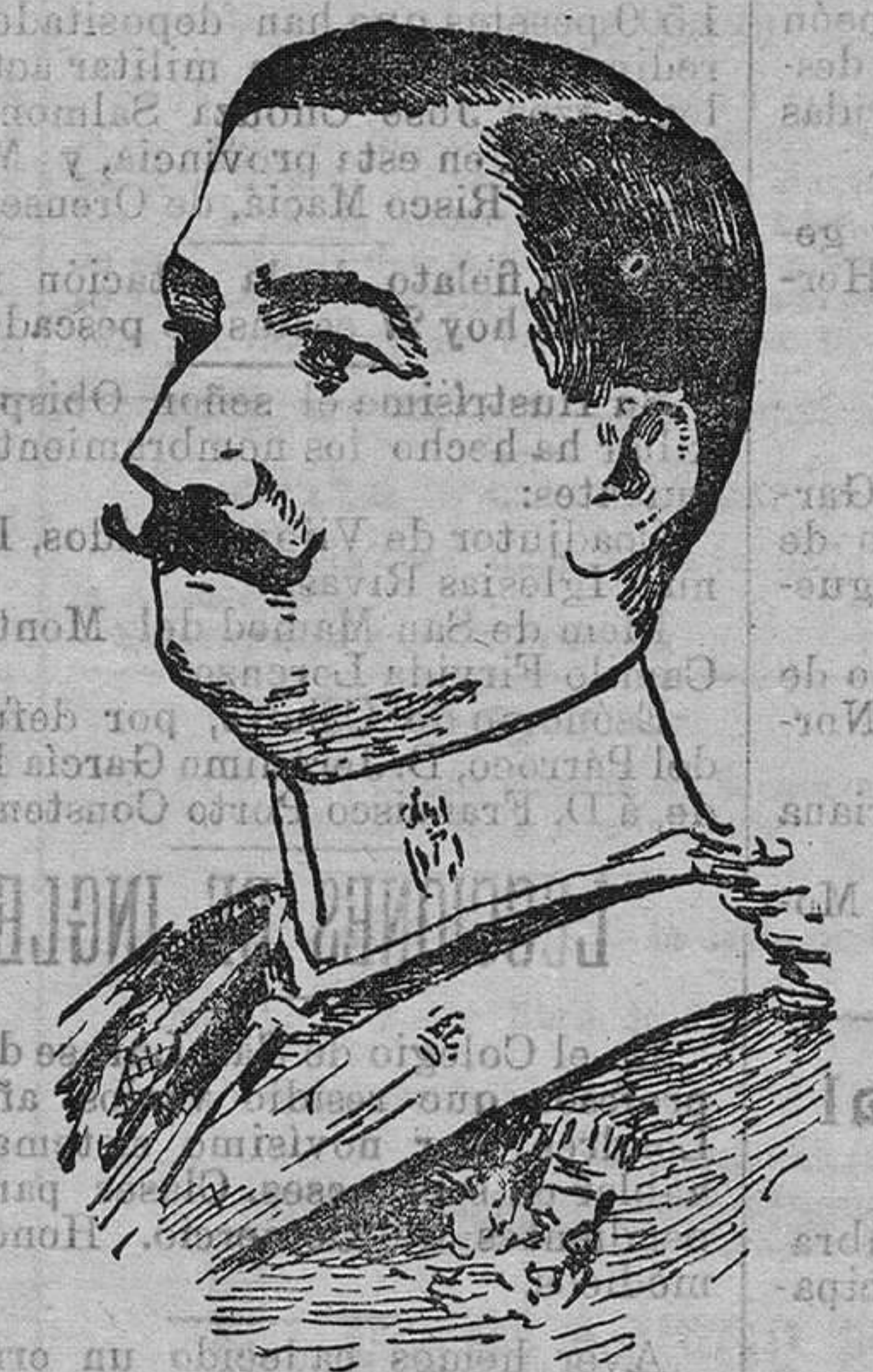
EL CORONEL BERENGUER

6.º Los actuales maestros de las escuelas nacionales de Primera enseñanza de las Provincias Vascongadas percibirán, a más del ascenso que les otorga el Real decreto de 14 de Marzo último, las cantidades que las Diputaciones provinciales se comprometieron a abonar a dichos maestros por retribuciones, y dejarán de percibir las al cesar en las escuelas que hoy tienen a su cargo, concesión a que tienen derecho en razón al Convenio celebrado con las Provincias Vascongadas al pasar al Estado las obligaciones de la Primera enseñanza de las mismas.