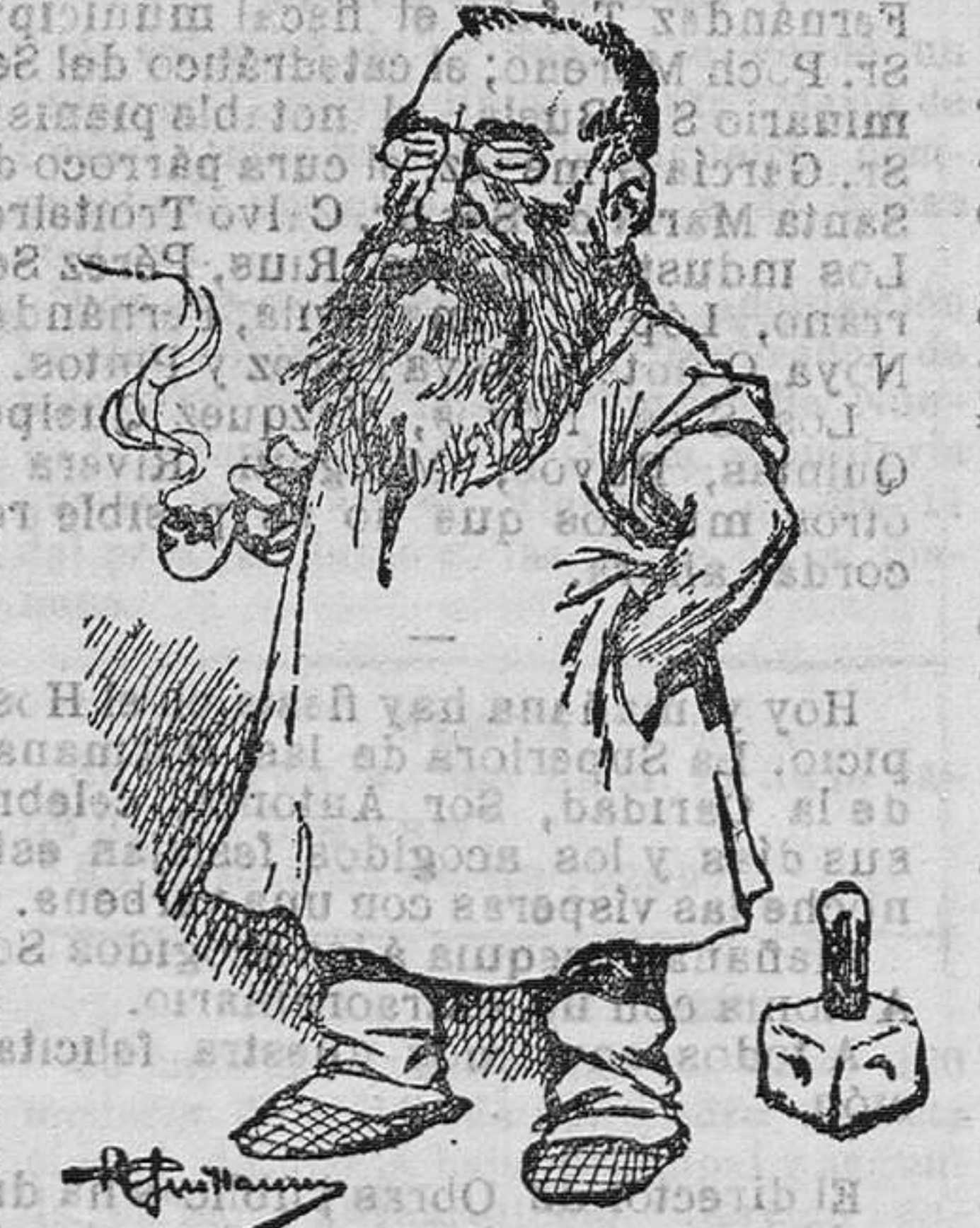
AUGUSTO RODÍN Caricatura por Guillaume.

Como si, setenta y cinco años de vida, y de ellos cuarenta de lucha constante por la gloria, no dieran al humano ser derecho al descanso, a la tranquilidad bien hechura y fortificante del hogar doméstico, el gran escultor francés Augusto Rodín, se halla hoy en su hispano, con el único objeto de estudiar los tesoros artísticos que encierran el Museo del Prado, la morisca Granada, la riante Sevilla y algunas otras poblaciones, famosas en todo el universo por las riquezas artísticas que poseen.