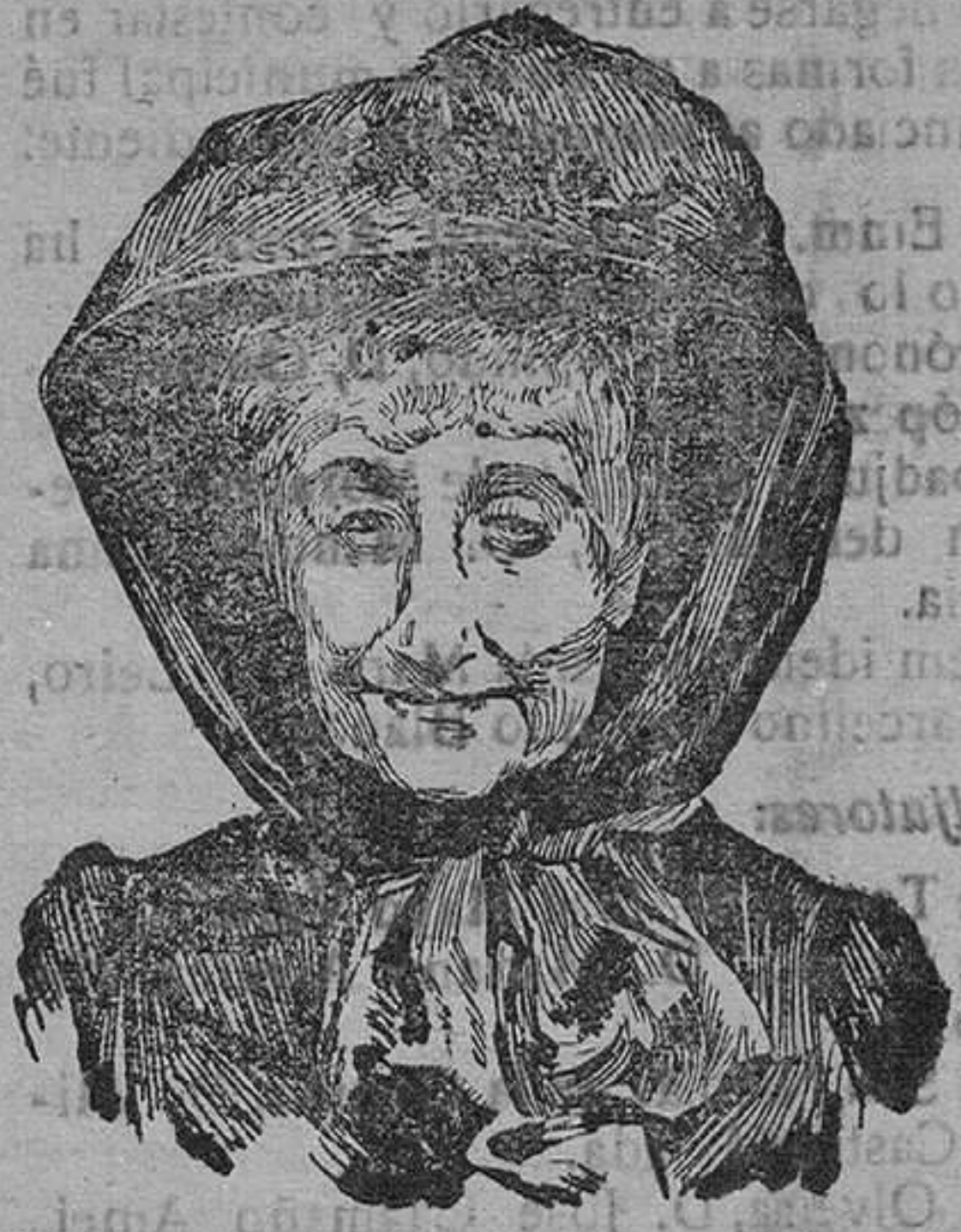
La emperatriz Eugenia, que ha llegado a París para someterse a una operación a la vista.