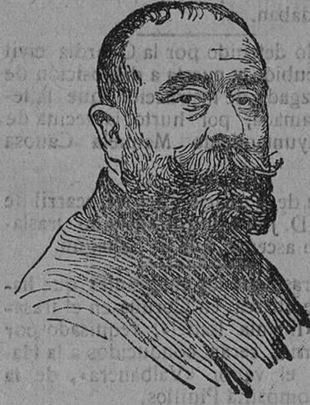
D. Juan de La Cierva, nuevo ministro de Hacienda