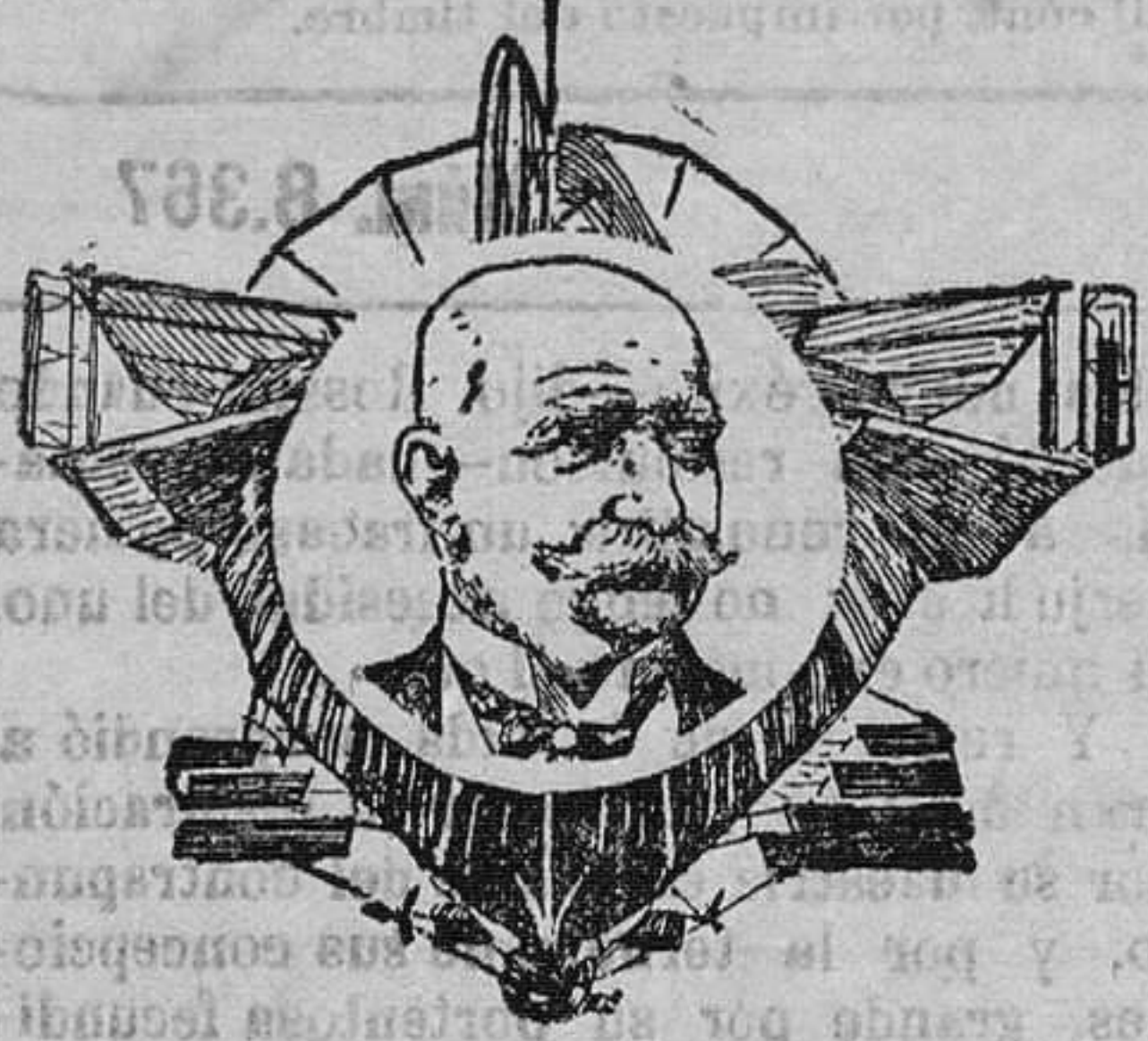
El conde Zeppelin y su dirigible

Al regresar Guillermo II de su visita al emperador Francisco José, kromprinz tuvo la original idea de salir al encuentro de su padre en el «Zeppelin» I, para desde él darle la bienvenida. A la hora convenida abandonó el aerostato su cseta flotante del lago Constanza, y efectuando varias evoluciones marchó al encuentro del tren imperial, al que siguió, buen tre-