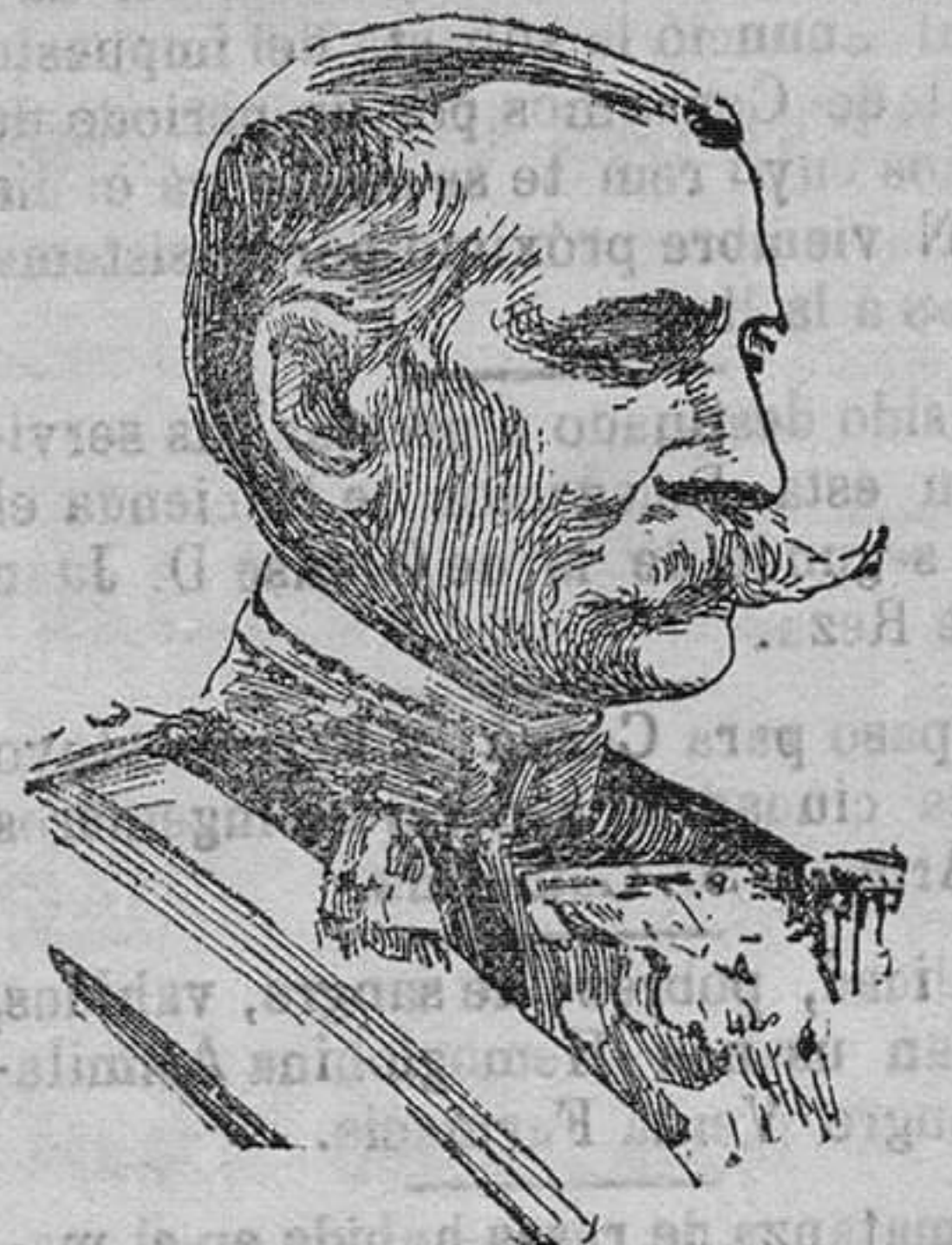
El general Martitegui

Una natural curiosidad por parte de todos aguijoneaba el espíritu para que la imaginación se forjase suposiciones más ó menos aventuradas, pero despejadas las incógnitas se supo que el general Martitegui recién regresado de su viaje de inspección a las plazas fuertes del Mediodía de España y de nuestras posesiones del Norte de Africa, presentaba su dimisión por no hallarse conforme con la resolución dada por el ministro de la Guerra al problema de las plantillas del Ejército.