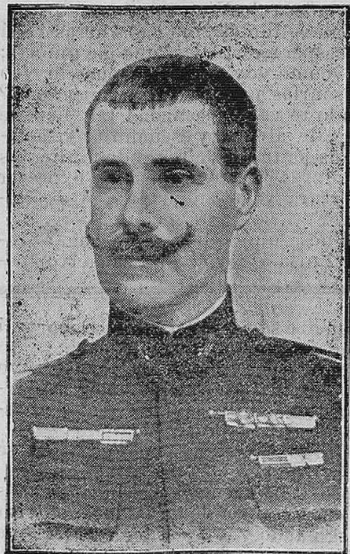
HENRIQUE DE PAIVA COUCEIRO Excapitan de Artillería del Ejército portugués, jefe de la restauración.

Salgari, Motta y Quattrini Cuadernos de 32 páginas profusa y artísticamente ilustrados á 20 cts. Lectura instructiva, interesantísima y económica. Se suscribe en El Eco de SANTIAGO. Se sirven las entregas á domicilio.