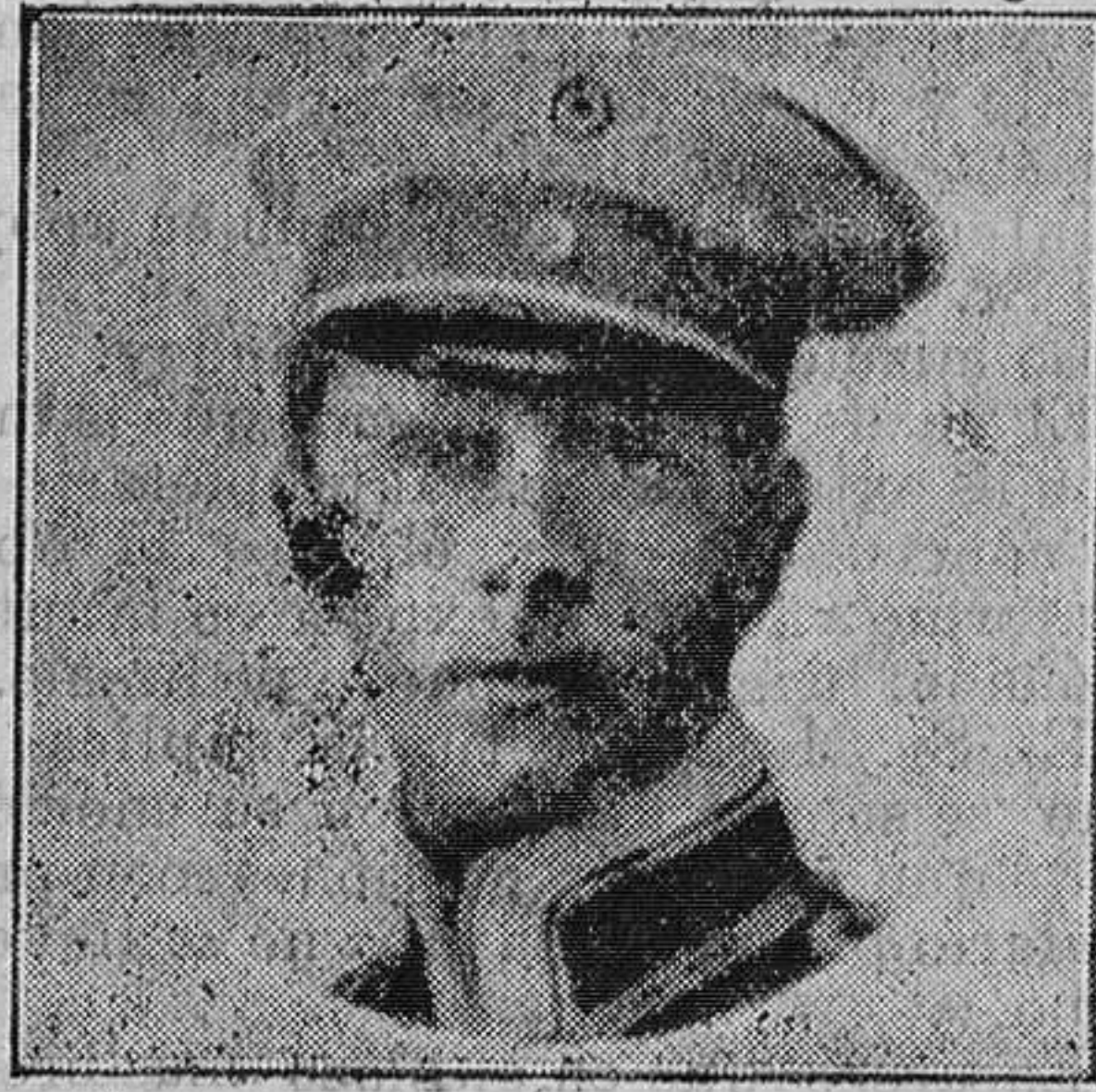
El Archiduque Carl

asistido á las fiestas de la coronación de los Reyes de Inglaterra, es el hijo mayor del difunto archiduque Otto y de la archiduquesa María Josefa de Sajonia y heredero presunto á la Corona de Austria-Hungría después de la muerte de S. M. el Kaiser y de su tío el archiduque Franz-Ferdinand, cuya esposa, la duquesa de Hohenberg, por haber contraído matrimoniomorganáticamente, no tiene derecho, según las leyes austriacas, á subir al trono.