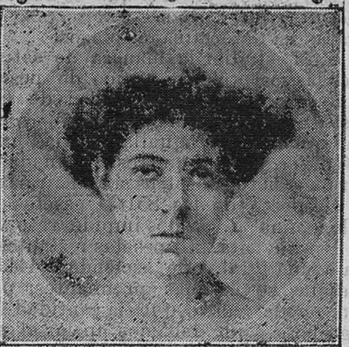
La Princesa Zita

Algunos periódicos muy bien informados de Austria y de Hungría dicen que el príncipe heredero Franz-Ferdinand, teniendo en cuenta estas circunstancias y no pudiendo compartir el trono de Austria con su esposa, la duquesa de Hohenberg, cederá, cuando el momento llegue, su puesto al archiduque Carl Franz-Josef. Por la misma razón, la Prensa austro-húngara saluda como futura emperatriz de Austria y reina de Hungría á la princesa Zita, cuya fotografía se puede ver en todos los escaparates de las tiendas de Viena y es reproducida por todos los periódicos y revistas de Viena y Budapest. La princesa Zita de Parma, que es una bellísima mujer, se parece mucho á la malograda emperatriz Isabel, desde cuya muerte las pocas fiestas que se han celebrado en la Corte de Austria no han revistido—por razones que el lector comprenderá—la esplendor que los vieneses estaban acostumbrados.