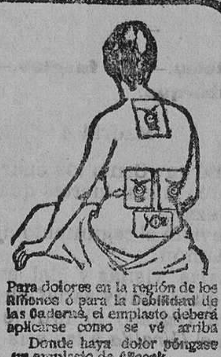
Para dolores en la región de los riñones ó para la debilidad de las caderas, el emplastro deberá aplicarse como se vé arriba. Donde haya dolor péguese un emplastro de ALCOCK.

Remedio universal para el dolor de caderas (tan frecuente entre las mujeres).