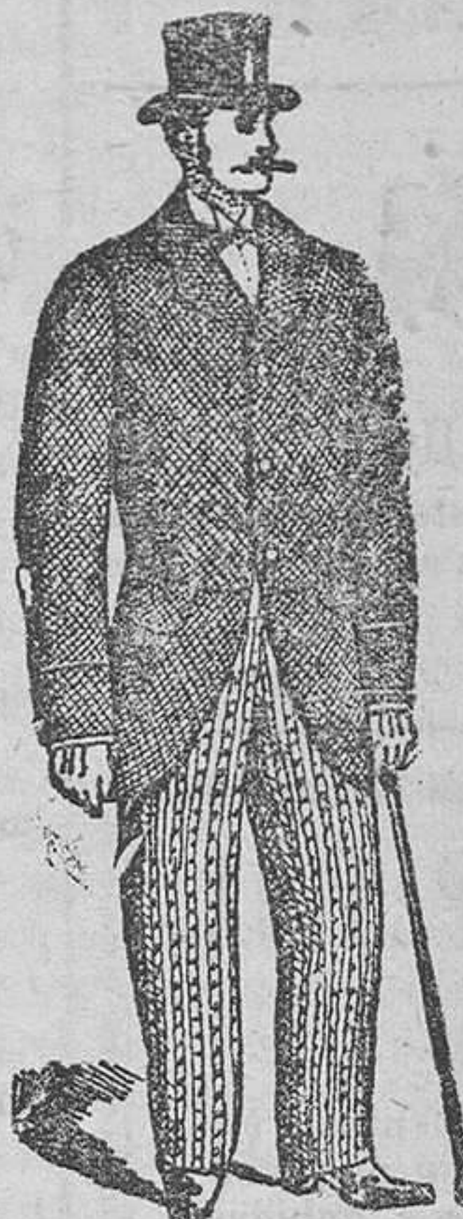
ma de los modelos parisienses.