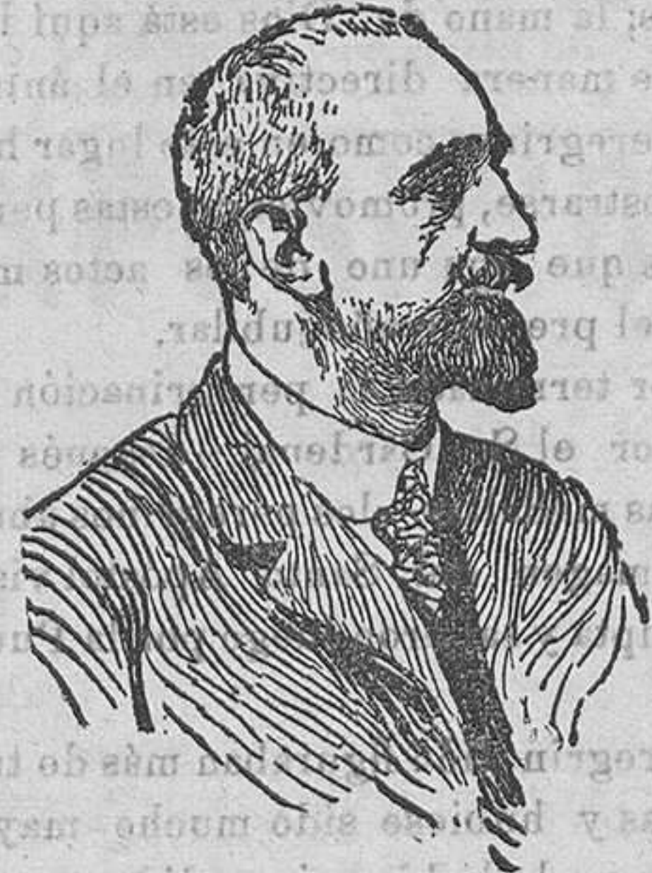
EL DR. CHARCOT

En 1902 esta misión encontraba en la tierra Victoria, en el Sur de Nueva Zelanda una inmensa nevera, completamente llena que se extiende hasta perderse de vista en dirección al polo. Sobre planicie de hielo el jefe de la expedición y Shackleton recorrieron sin dificultad 450 kilómetros hacia el Sur. Solamente la muerte de sus perros les obligó a retirarse.