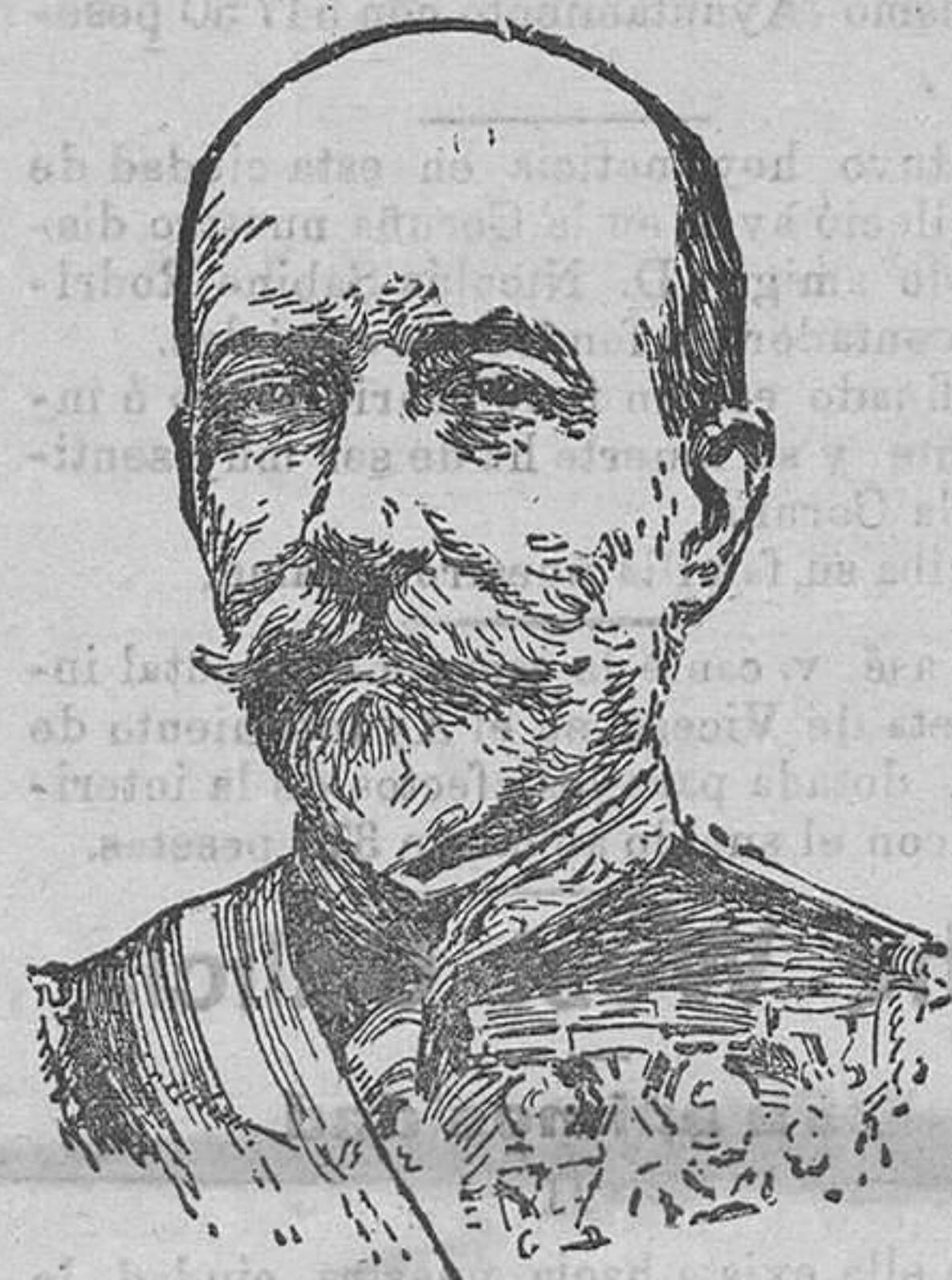
Nuevo ministro de la Guerra