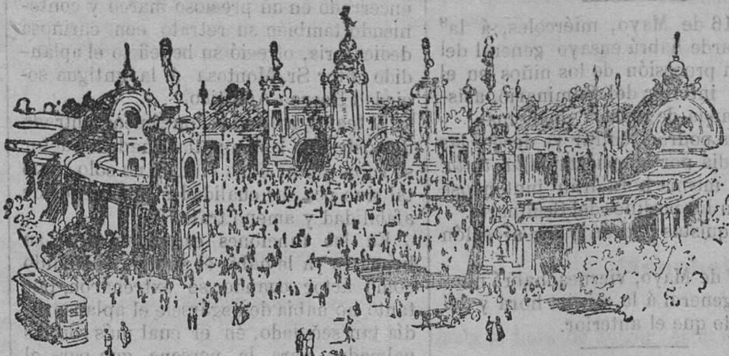
ENTRADA PRINCIPAL DE LA EXPOSICIÓN DE MILÁN

Respecto á los beneficios que á la Humanidad puede producir el Certamen, las esperanzas son bien halagadoras y lisonjeras: hay convocados 120 congresos, á los que han enviado su adhesión 300.000 individuos de todos los países de mundo.