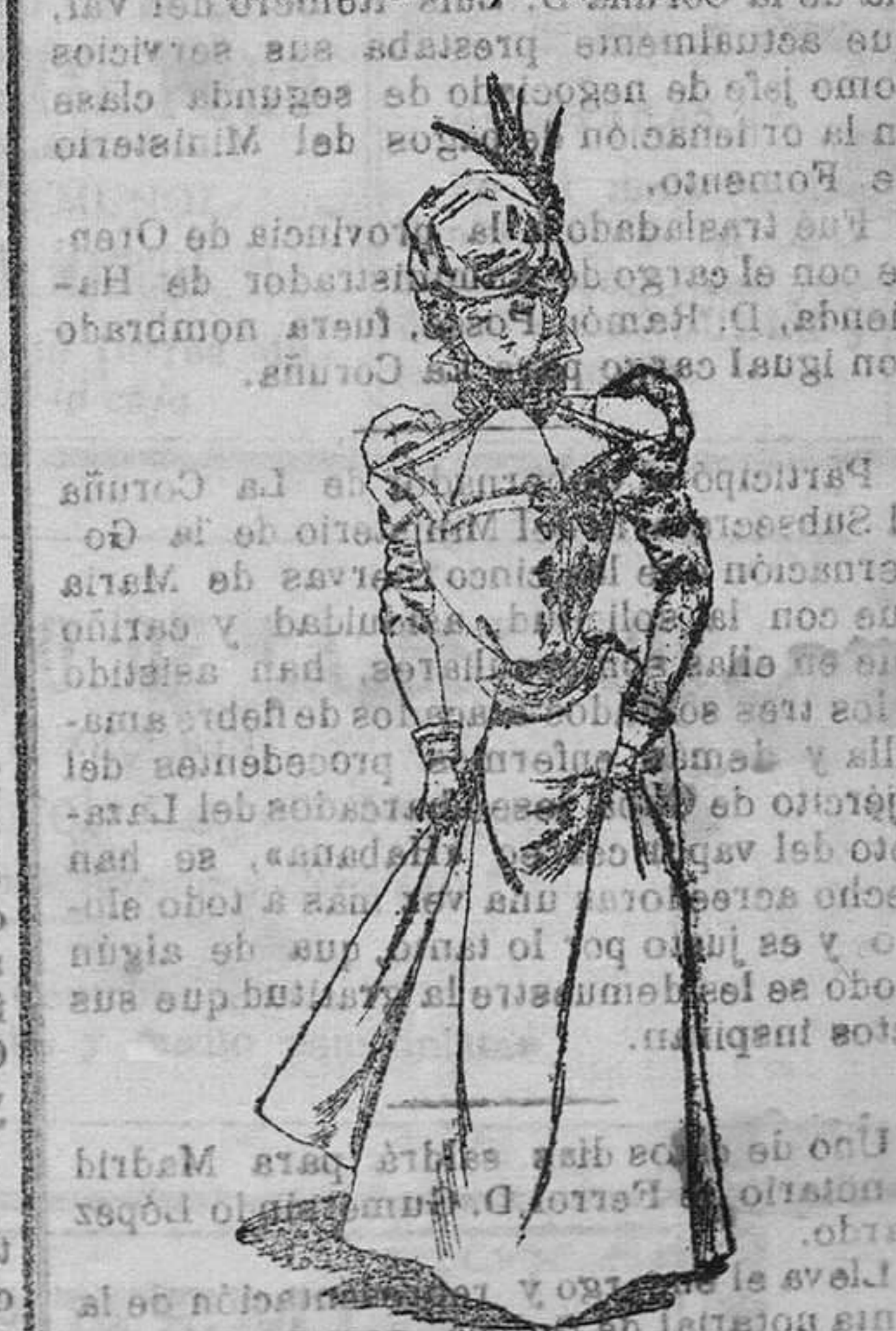
Traje para paseo.

Modelos exclusivos para nuestras lectoras de los Grandes Almacenes de EL SIGLO, Barcelona