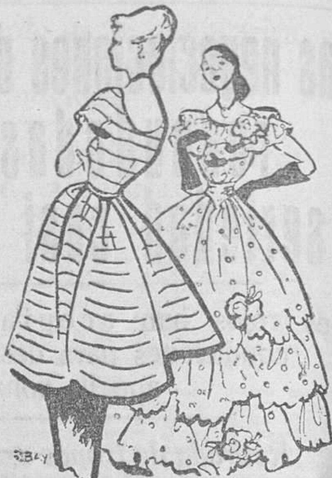
echarpes en taffetas plisado, grandes paraguas blancos... CREACIONES DELANTAL

—Botonaduras en flecha, cinturones en tres colores, grandes nudos aplastados,