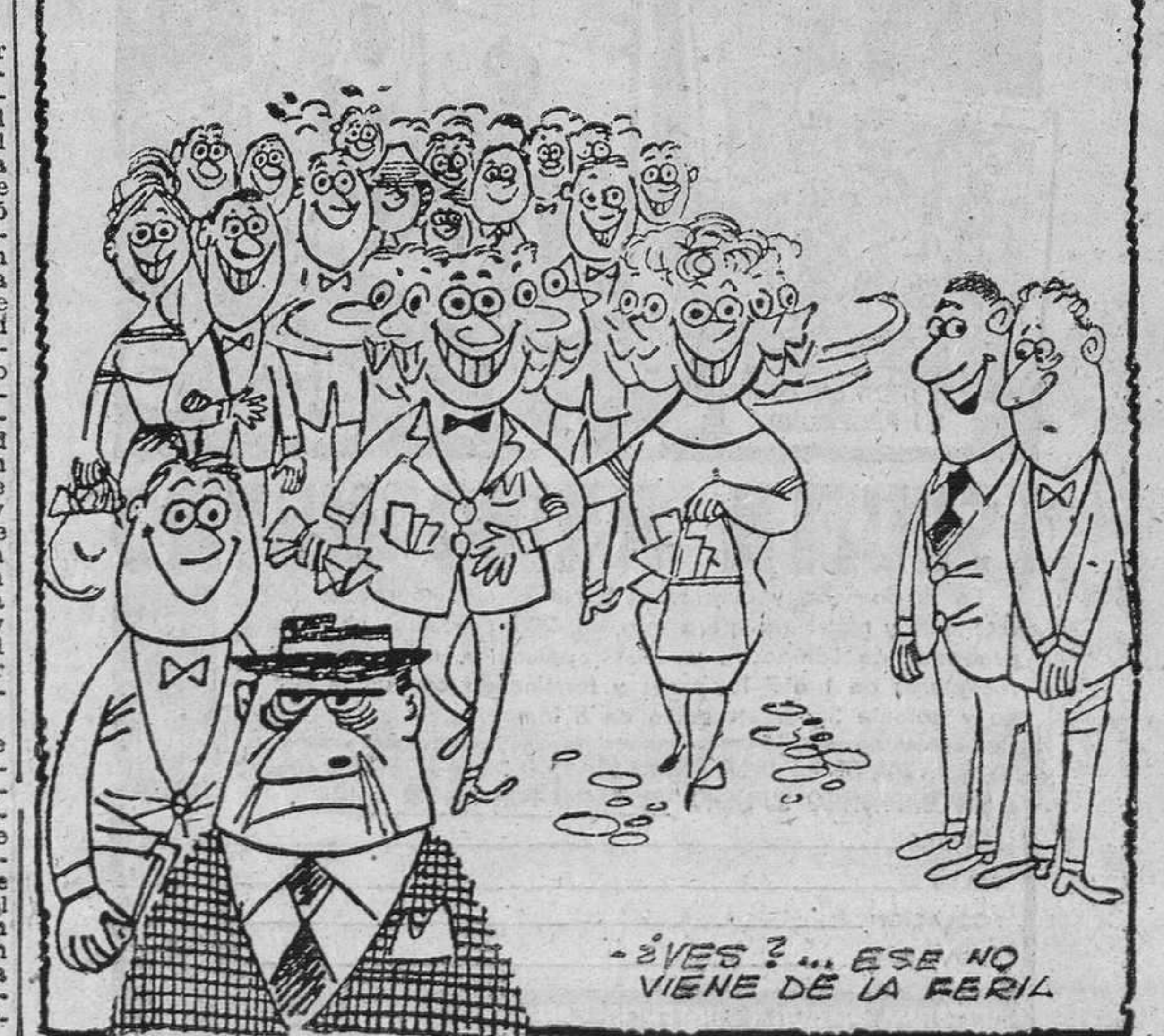
¿VES?... ESE NO VIENE DE LA PERIA