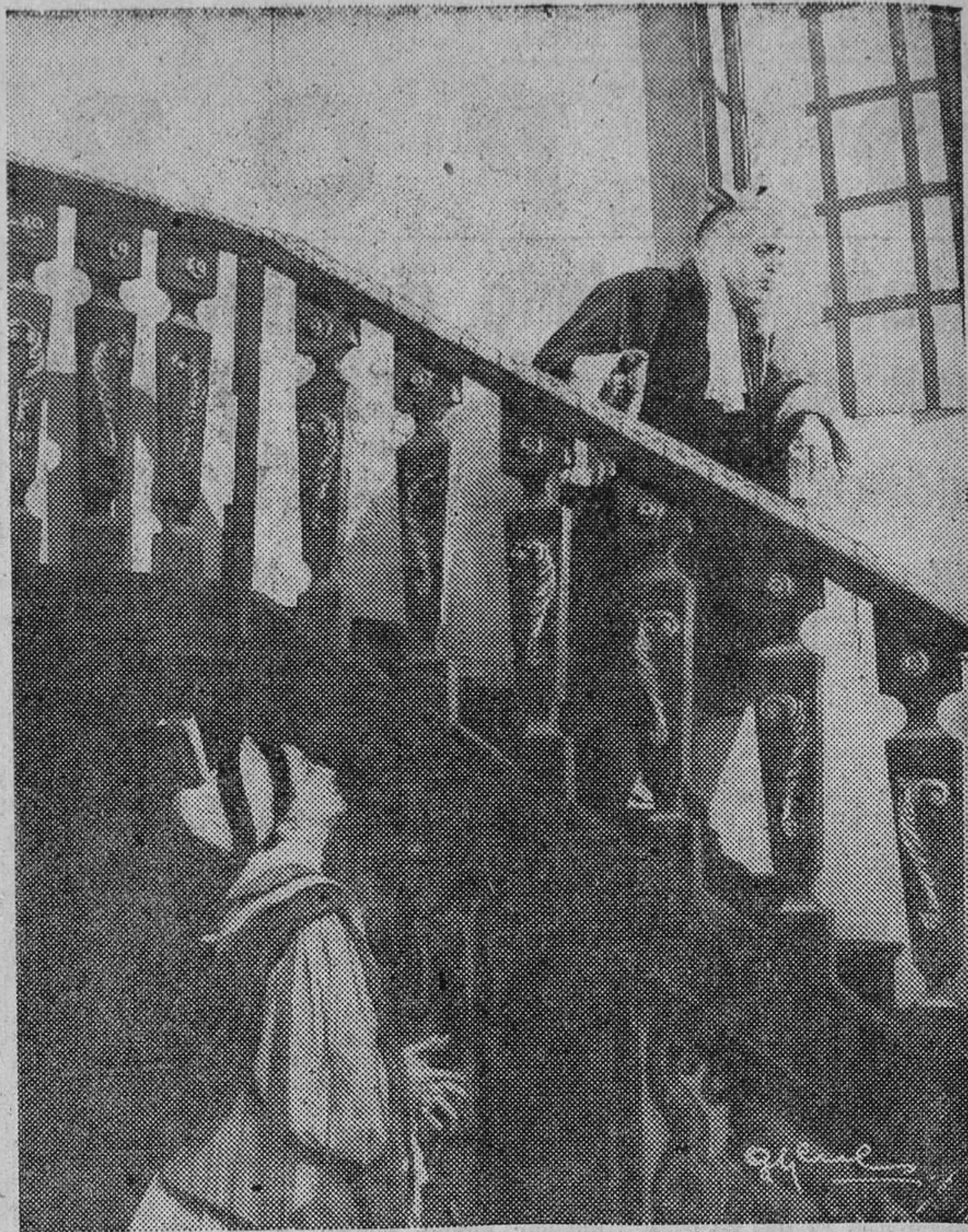
Una de las escenas de «El avaro», de Moliere

La Compañía Lope Vega, que tan resonante éxito ha tenido con las representaciones de «Las Meninas», ofrecerá esta noche a las once y mañana a la misma hora, en el Palacio de Carlos V, dos representaciones de la gran obra clásica, «El avaro», de Moliere, que esta compañía bajo la dirección de Pepe Tamayo, ha conseguido presentar de manera asombrosa y en donde Carlos Lemos ha alcanzado una de las más afortunadas interpretaciones de su dilatada carrera llena de éxitos. El interés de los granadinos por estas representaciones de «El avaro», después del triunfo obtenido el sábado y domingo con «Las Meninas», permiten suponer que esta noche registrará un lleno el imperial palacio de Carlos V.