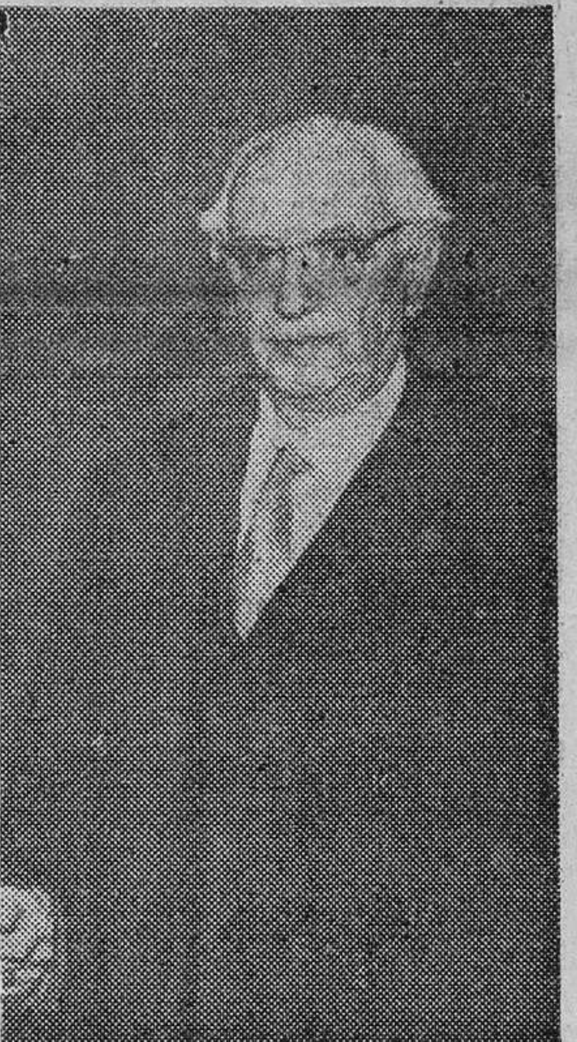
Don José María Pemán clausuró ayer el ciclo del Círculo Balmes con una conferencia sobre el tema "De la guerra a la Monarquía". (Información en Pág. 3)