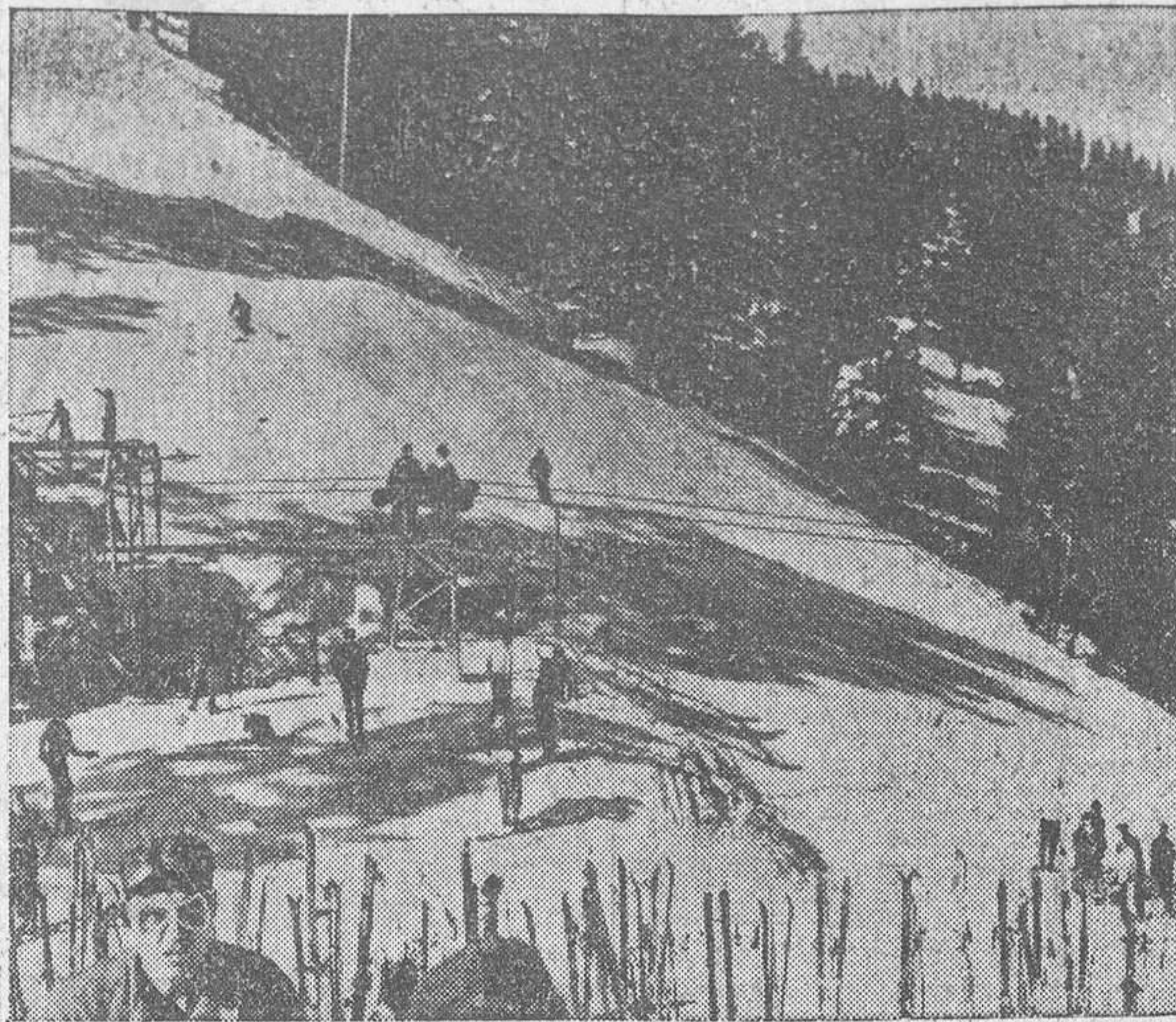
Una vista del Valle del Sol, en el Estado de Idaho, uno de los centros de deportes de invierno más populares en Norteamérica.