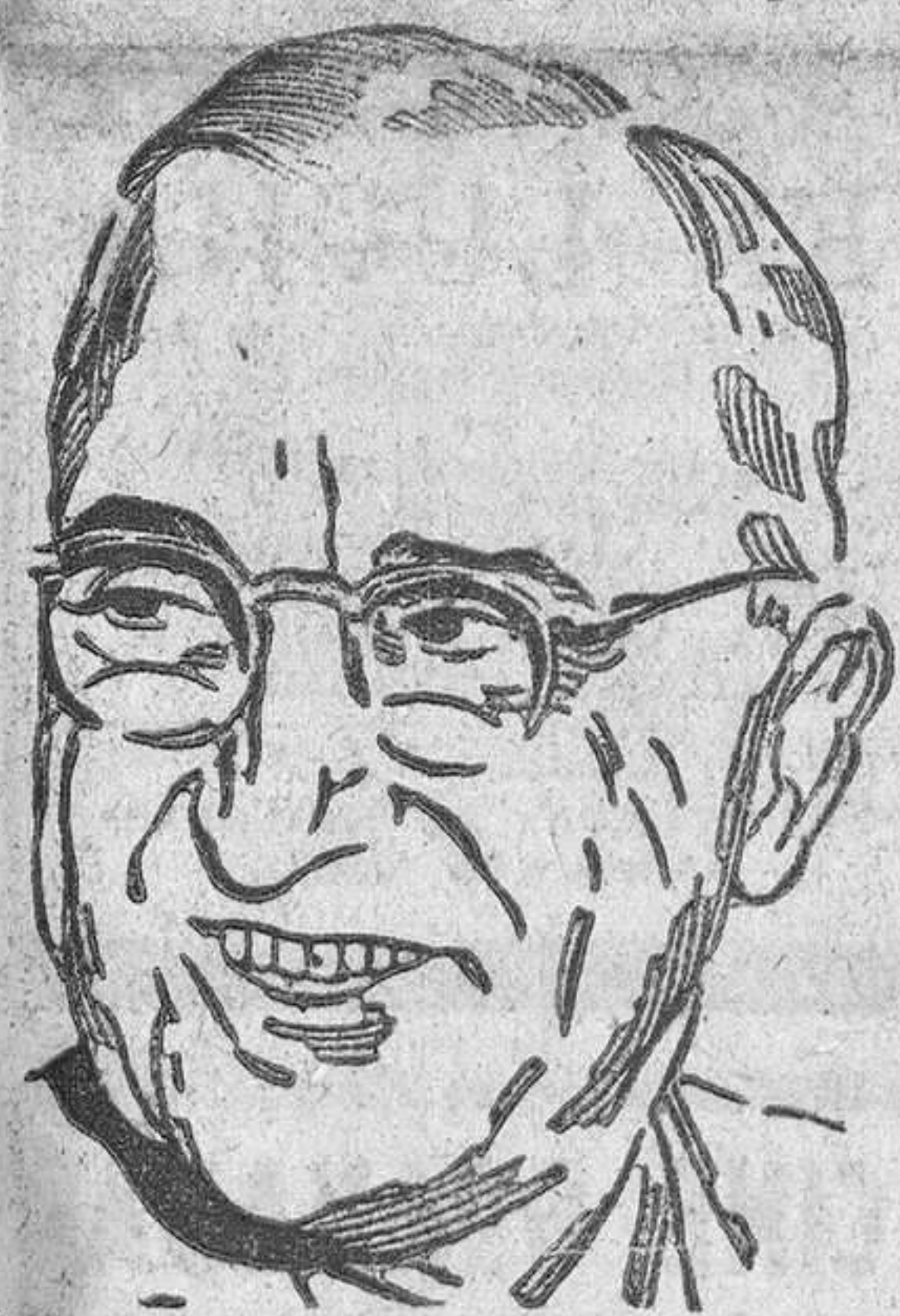
marido la señora de Truman: «Naturalmente. Cualquiera cosa que él diga está perfectamente».

Al abandonar el lugar donde se había celebrado el banquete, Truman fué interrogado por los periodistas acerca de si su decisión quedaba sujeta a algún cambio. El presidente contestó rotundamente: «No, a ninguno en absoluto». Los periodistas insistieron: «¿Está contento con su decisión?». Sonriendo, contestó por su