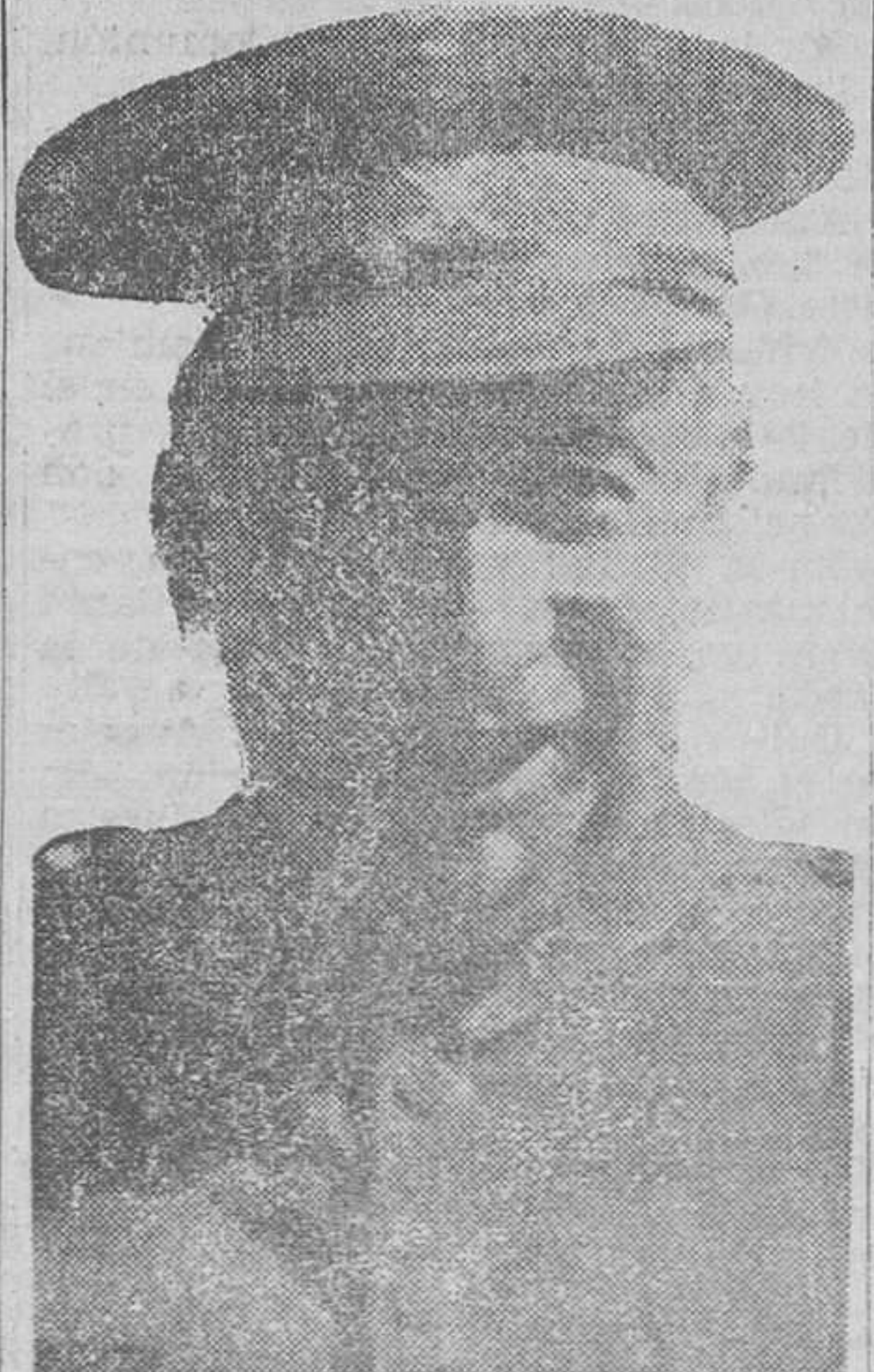
EL GENERAL ORGAZ

Preguntado qué impresión le causaba la compenetración tan íntima que existe entre el pueblo musulmán y la España nacional, el general Orgaz respondió sonriendo: «Esa sí que es una pregunta compleja, y que yo me sé bien por mi cargo de Alto Comisario; pero, para contestarla, basta sólo con una palabra: sacrificio. No hay nada más que ver cómo se están portando en la guerra los marroquíes.»