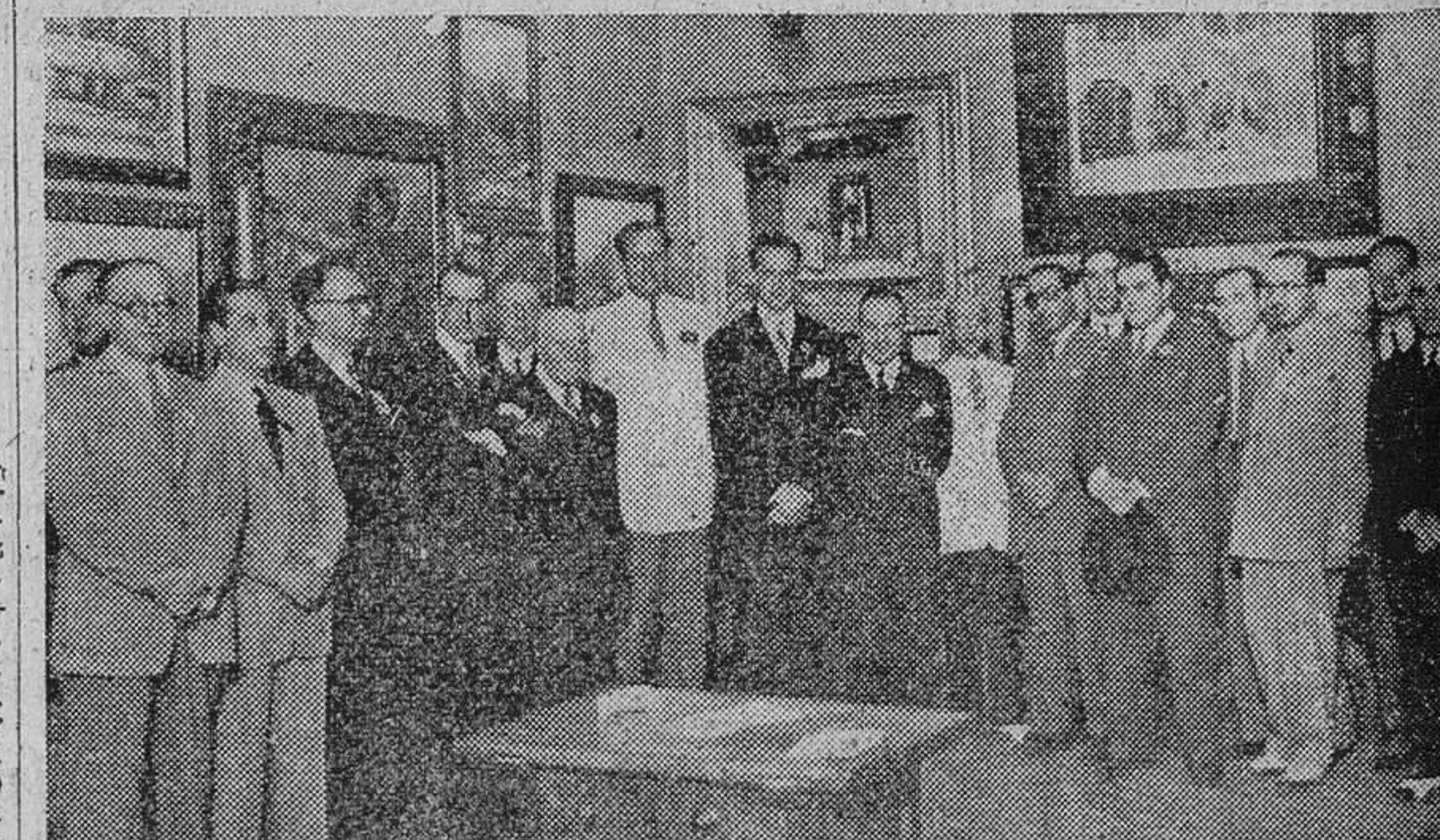
El Gobernador civil, el Alcalde y los periodistas madrileños visitando la Exposición Latorre, en la Asociación de la Prensa.

Muy visitadas también las Exposiciones del Centro Artístico, la de Gil Tovar y la de Educación y Descanso