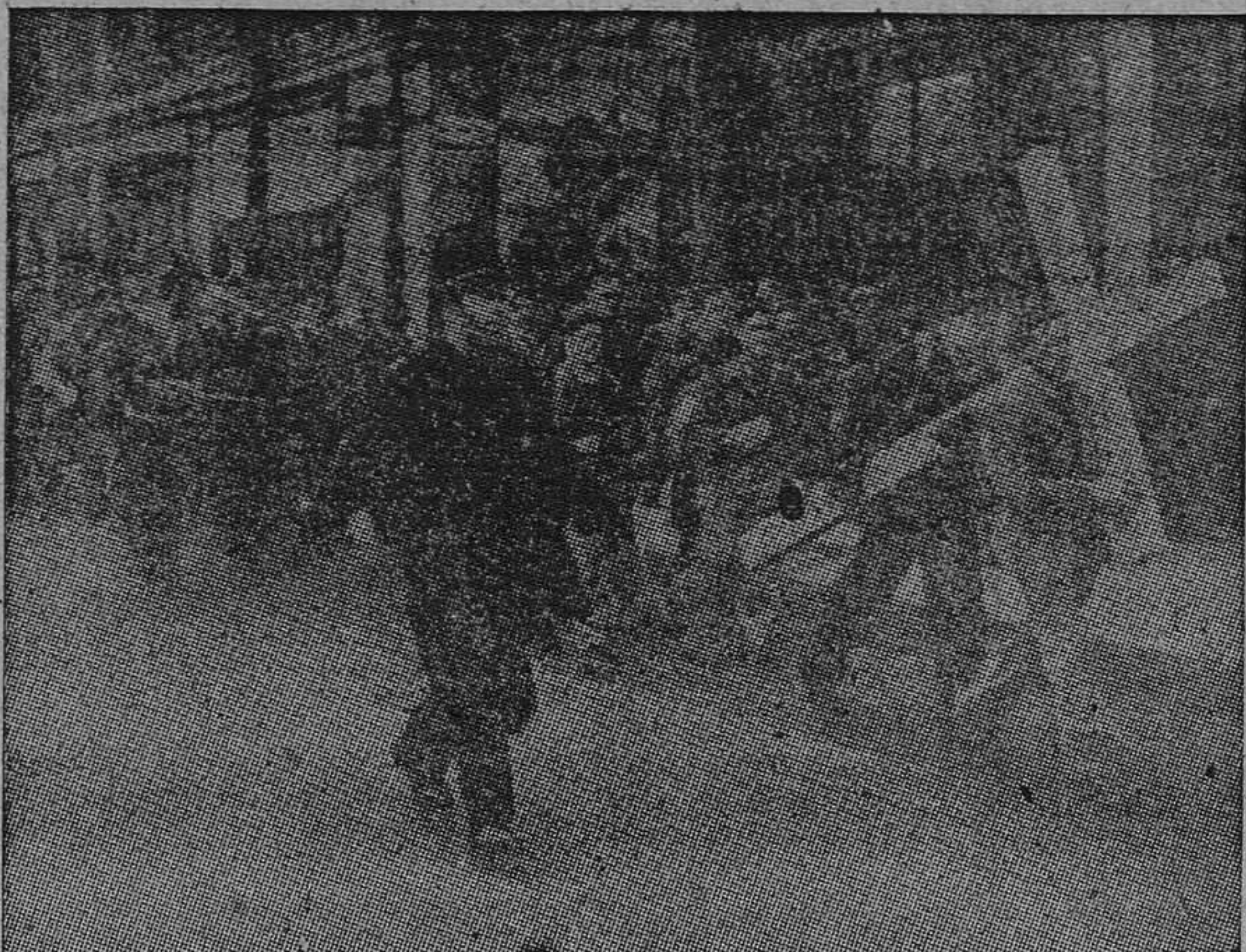
Un grupo de estudiantes católicos de la Universidad de Londres atraviesan las calles de la gran ciudad con una cruz que más tarde erigieron en Walsingham en una gran peregrinación.