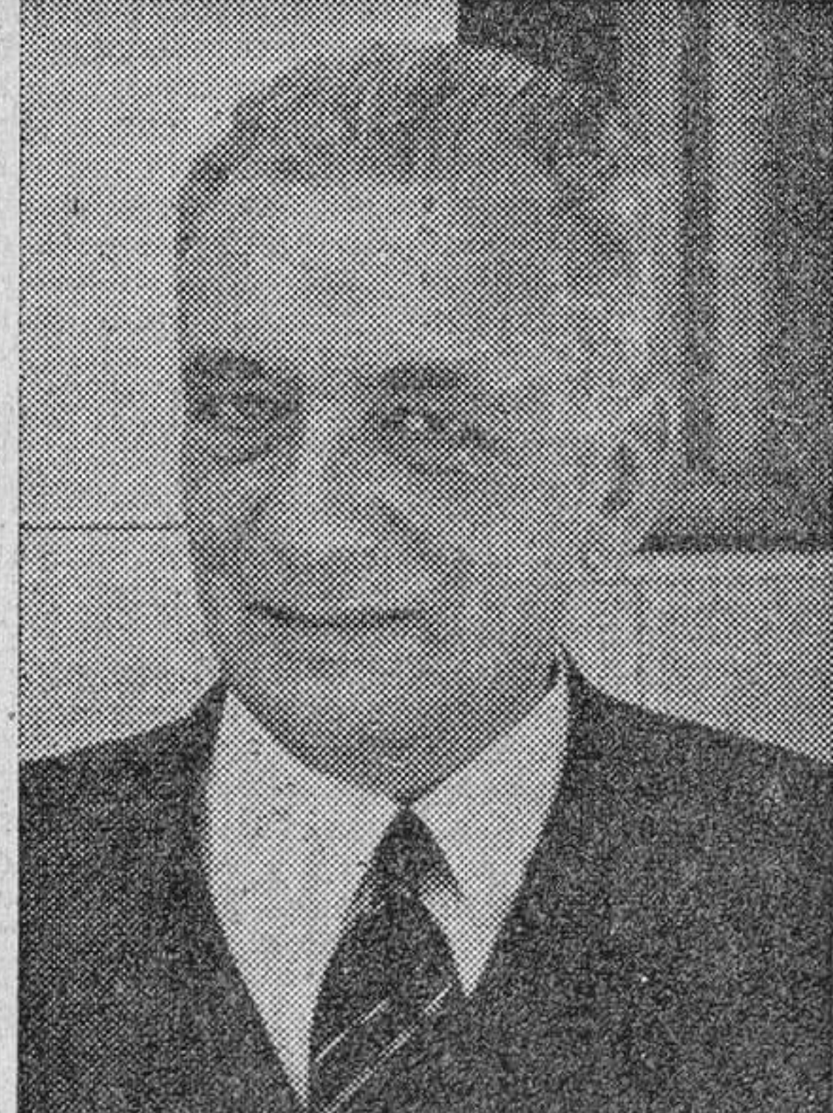
Laureano Gómez, presidente de Colombia, depuesto y detenido.

(Amplias informaciones deportivas, en págs. 6, 7 y 8)