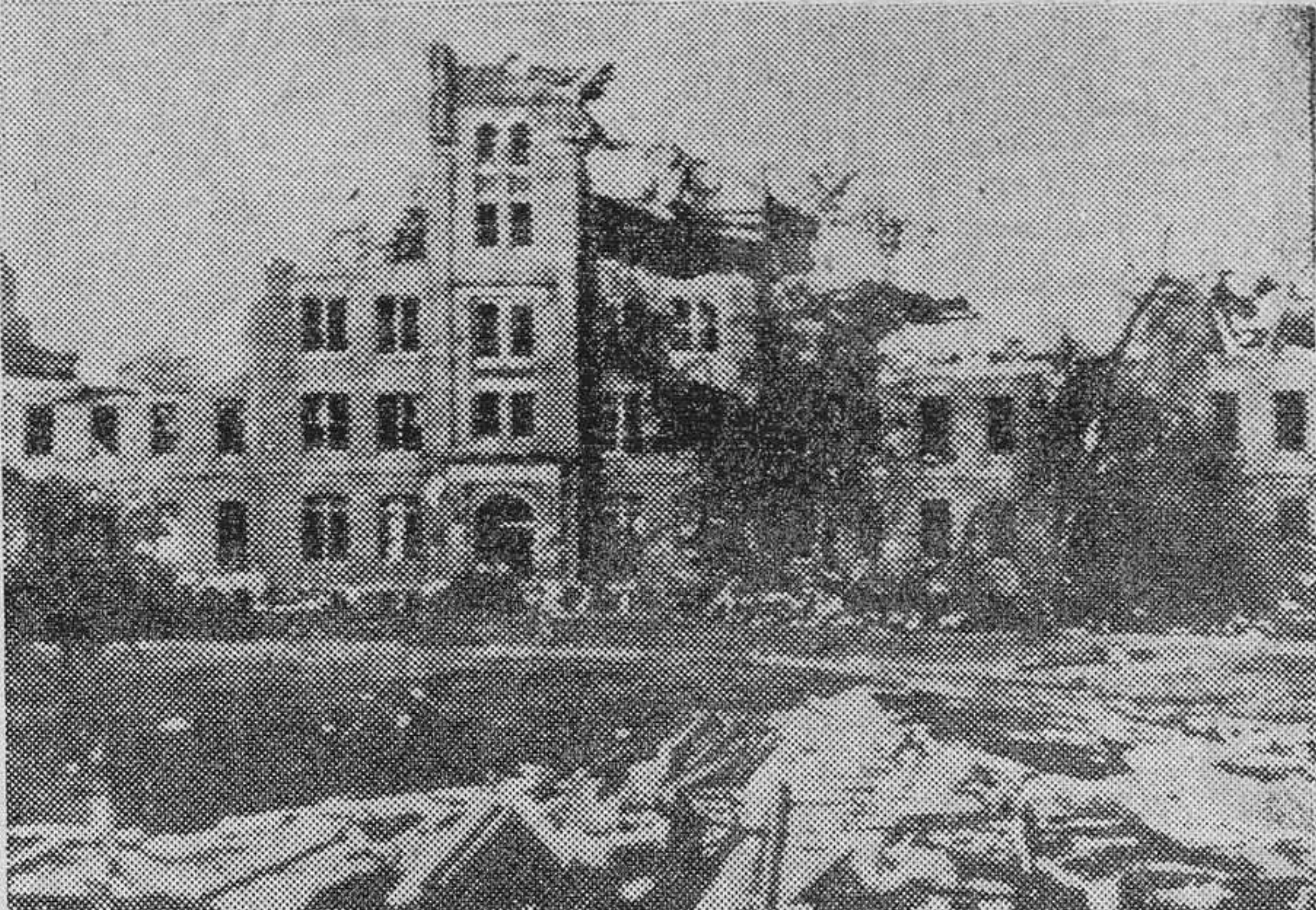
En la radiografía pueden apreciarse los cuantiosos daños ocasionados por los sucesivos tornados registrados en algunas regiones de los Estados Unidos. He aquí todo lo que quedó de un edificio de Worcester, en Massachusetts, después del tornado.