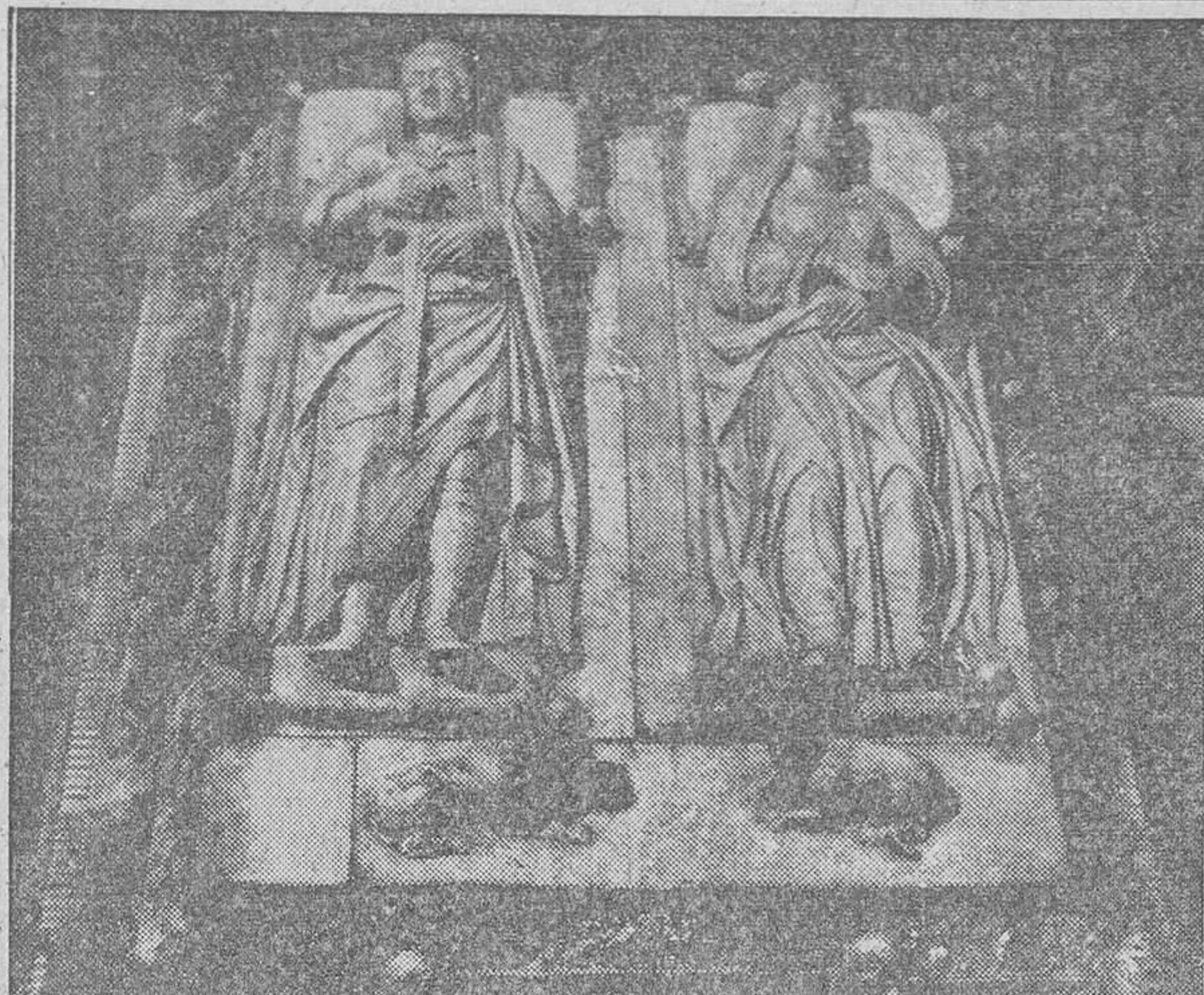
Historia viva fundida en piedra. Ambición de Imperio. Consigna de Unidad. Eso significan esos sepulcros augustos que guardan, en el dulce recato de la Capilla Real de Granada, el polvo de los soberanos que hicieron España y ensancharon el Mundo.

ATENTADO CONTRA LA POLICIA IRLANDESA BELFAST, 11.—Una bomba ha hecho explosión en los alrededores de un cuartel de policía situado en una zona muy populosa de la ciudad. Fueron heridos dos agentes de la autoridad, uno de los cuales falleció. Ambos policías fueron además blanco de disparos de fusil. (Efe).