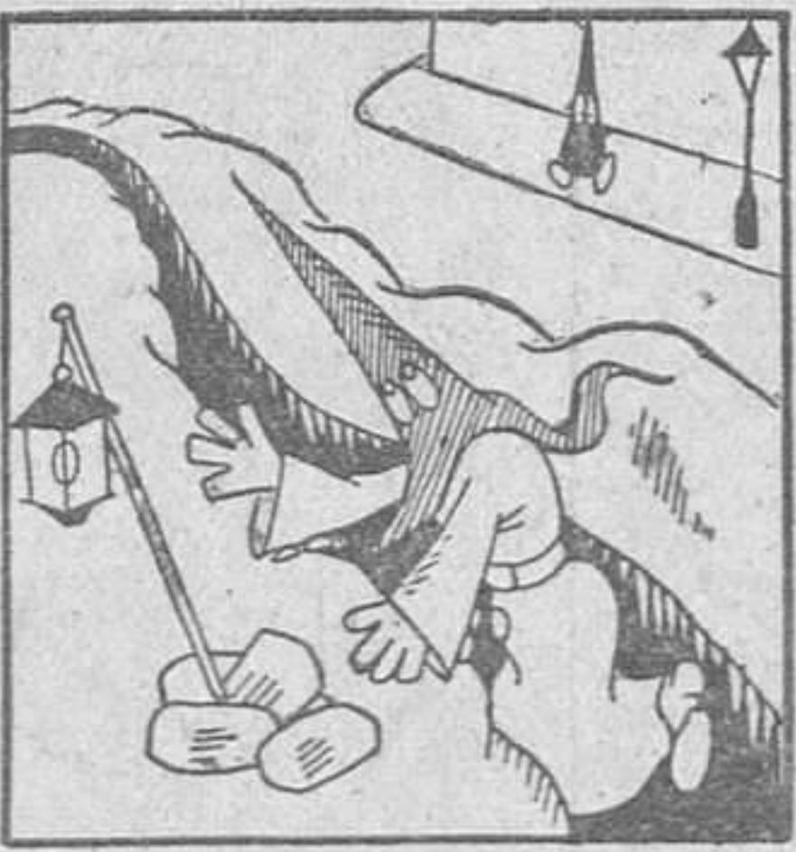
SEMANA SANTA Un paso mal dado