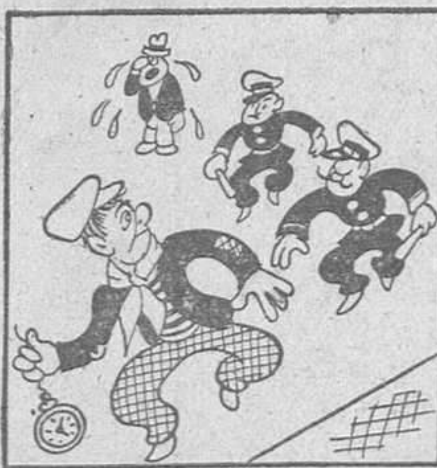
TEMPORADA TAURINA El «Niño del Reloj» en la primera corria de la temporada