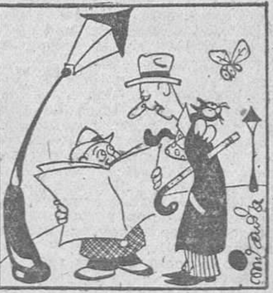
CINEFUTBERIA Pasemos revista. Valencia-Celta, empate. Coruña-Barcelona, empate. Alicante-Granada, empate. —Sí, La revista Pathe.