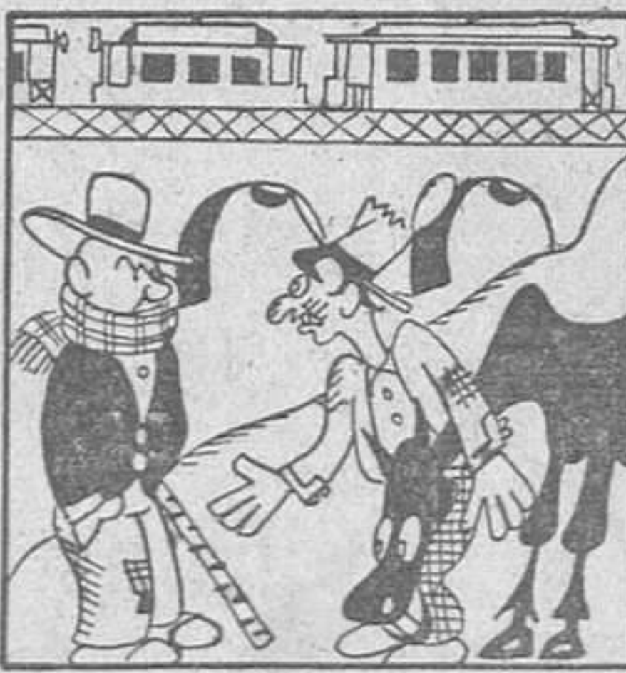
FERIA DEL JUEVES —¿Que mi «Rocinante» es un penco? ¡Te veas como el puente Genil, con los ojos abiertos y siete tranvías encima!