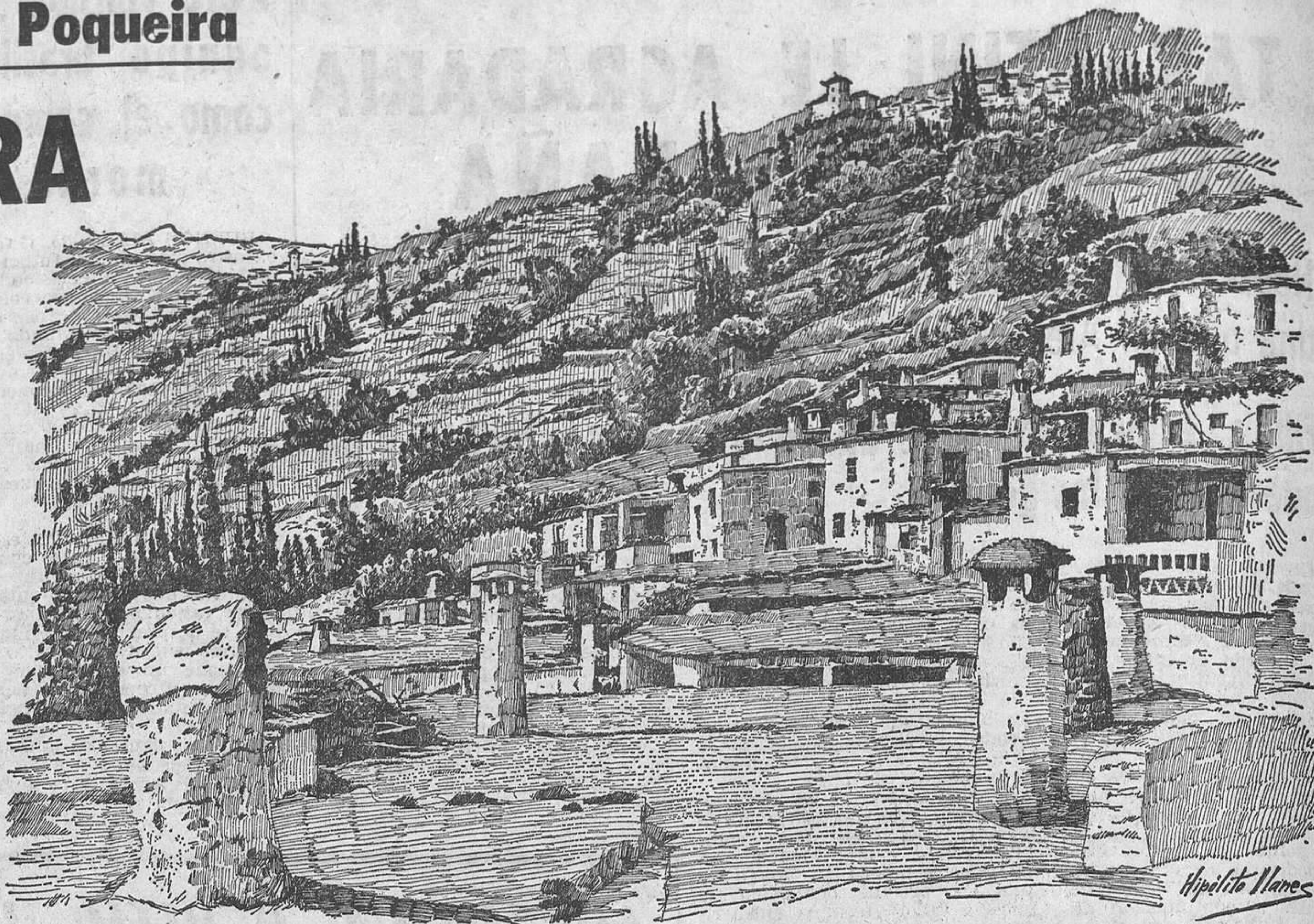
Barranco del Poqueira. En primer plano, Pampaneira; arriba, Bubi6n y al fondo, Capileira y las cumbres de Sierra Nevada. (Dibujo de Hip6lito Llanes)