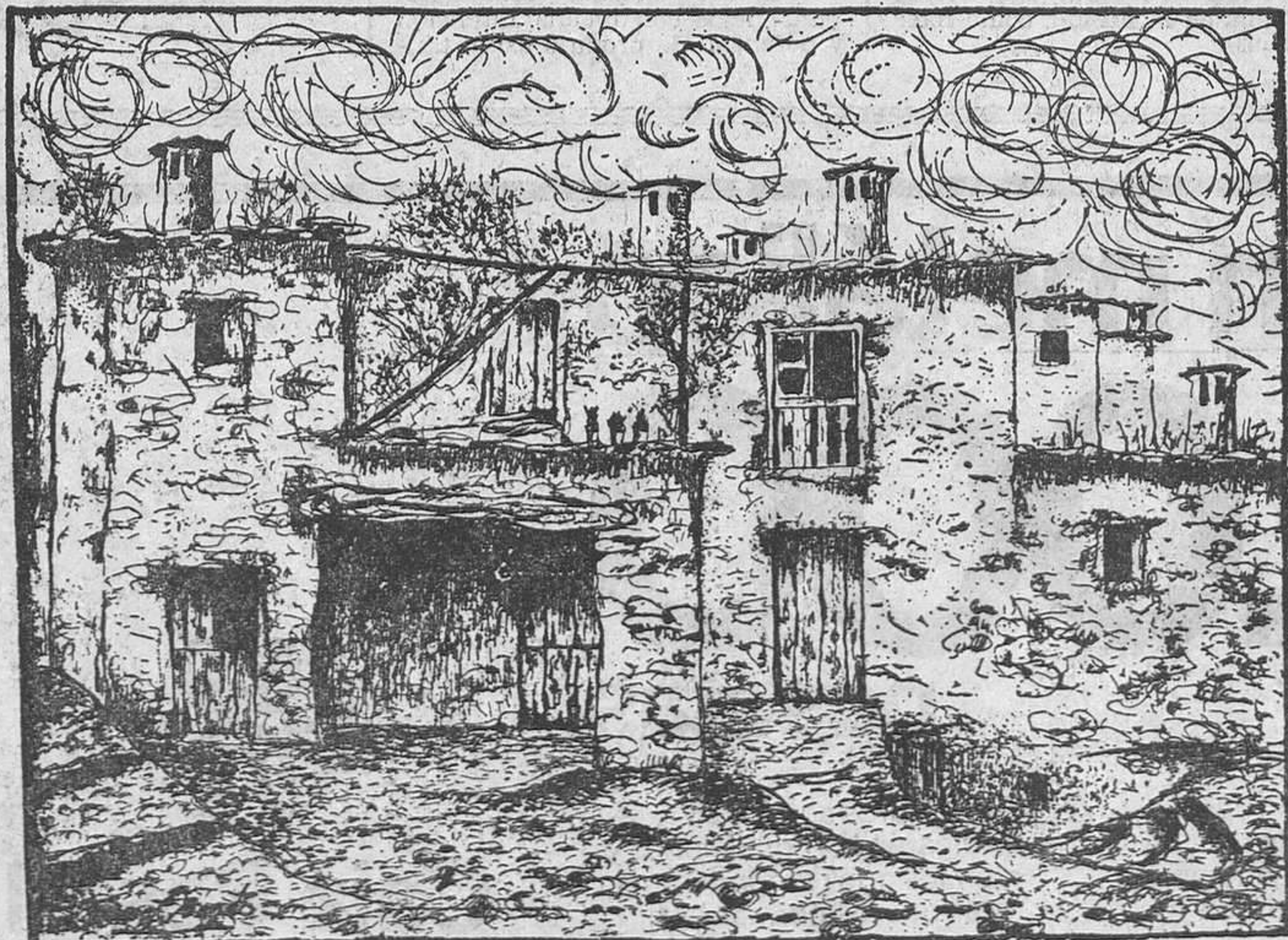
«Casas de la Alpujarra», grabado al aguafuerte de Gómez Benito

6. Esta conservación integrada debiera convertirse en uno de los objetivos de ordenación del territorio, ya que implica una política de desarrollo orientada a las relaciones equilibradas entre el Hombre y la Naturaleza.