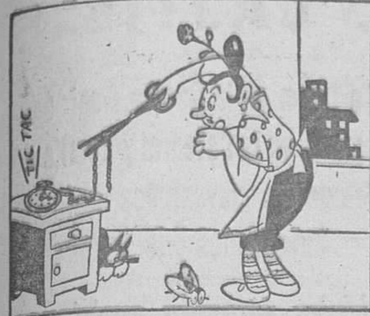
—¡Qué rabo más largo!