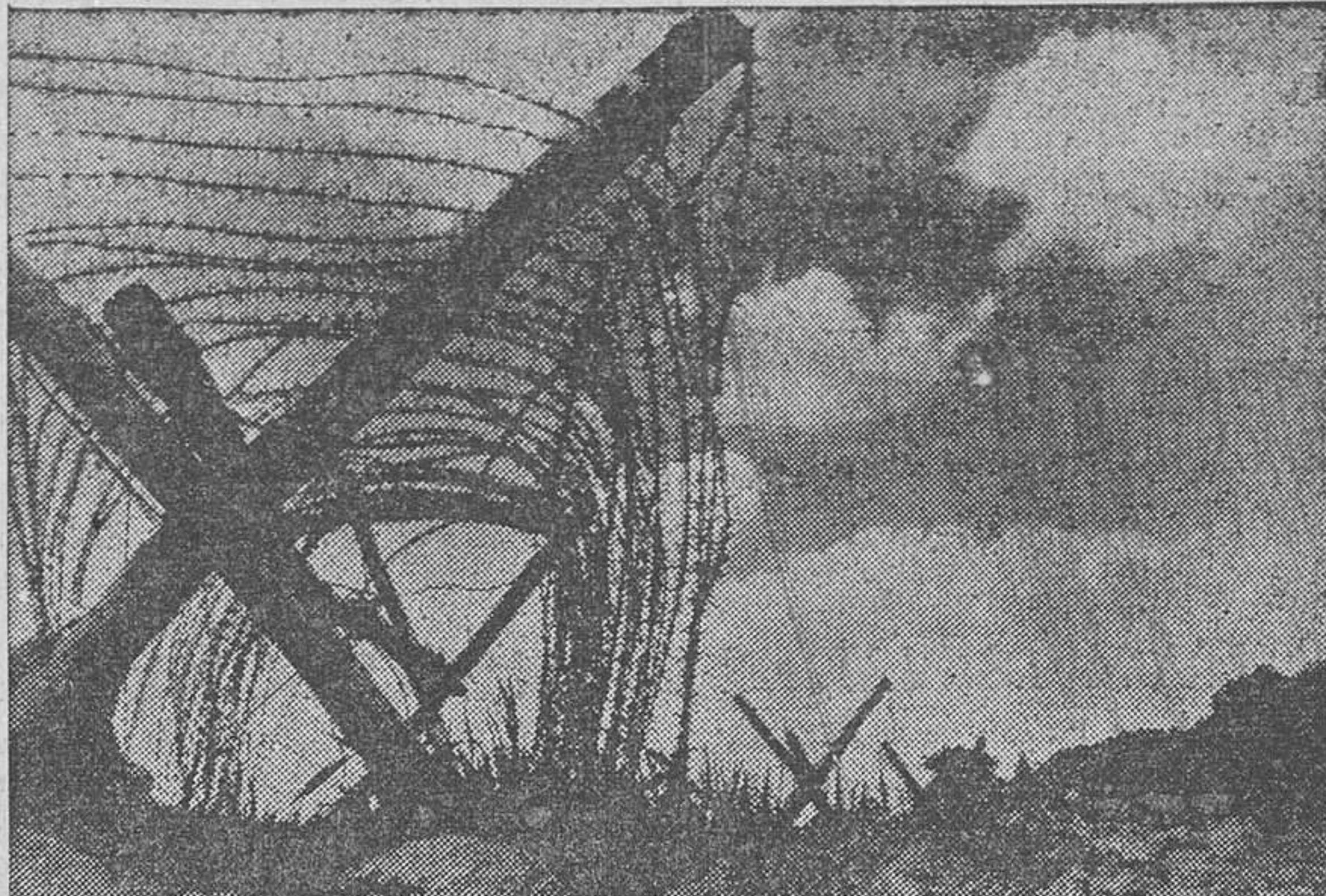
Entre los sistemas defensivos del Eje en las distintas costas que controlan están las alambradas espinosas que bordean el litoral