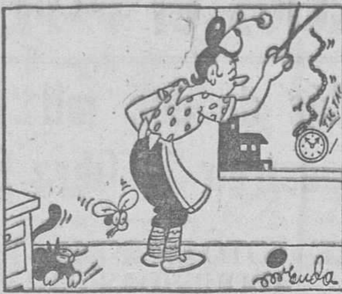
—¡En mi vida he visto un bi-cho tan raro!