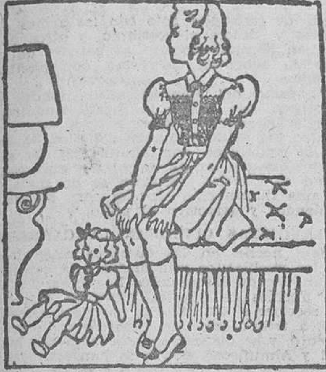
Vestido de crepón o de lana color naranja, fruncido y adornado con nido de abeja, marrón.