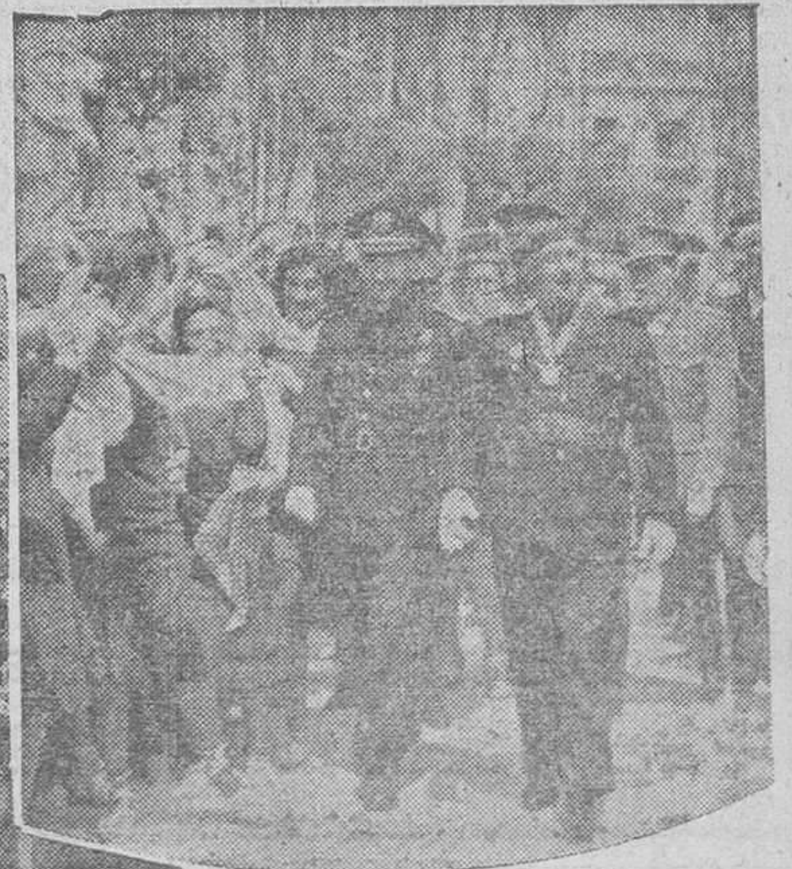
El Caudillo, después del desfile falangista, se dirige acompañado por el Ministro Secretario, al Alcázar sevillano, entre las aclamaciones de la multitud. Camaradas de la Sección Femenina le vitorean con entusiasmo.