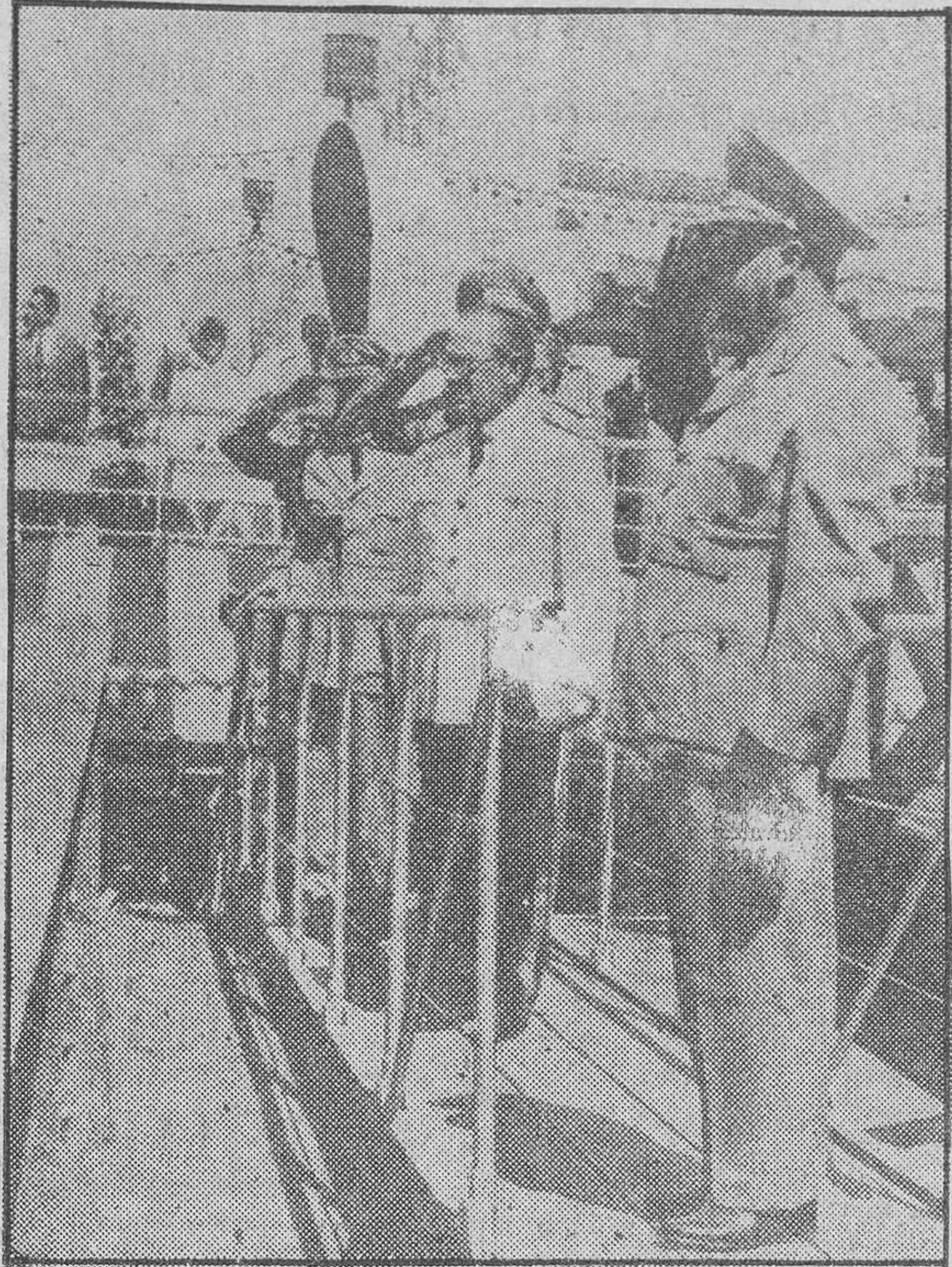
Con los honores militares inherentes a su rango, es despedido el Presidente venezolano después de la visita que realizó al «Ciudad de Toledo», exposición flotante española que inauguró oficialmente, acompañado del embajador de España y de otras autoridades.