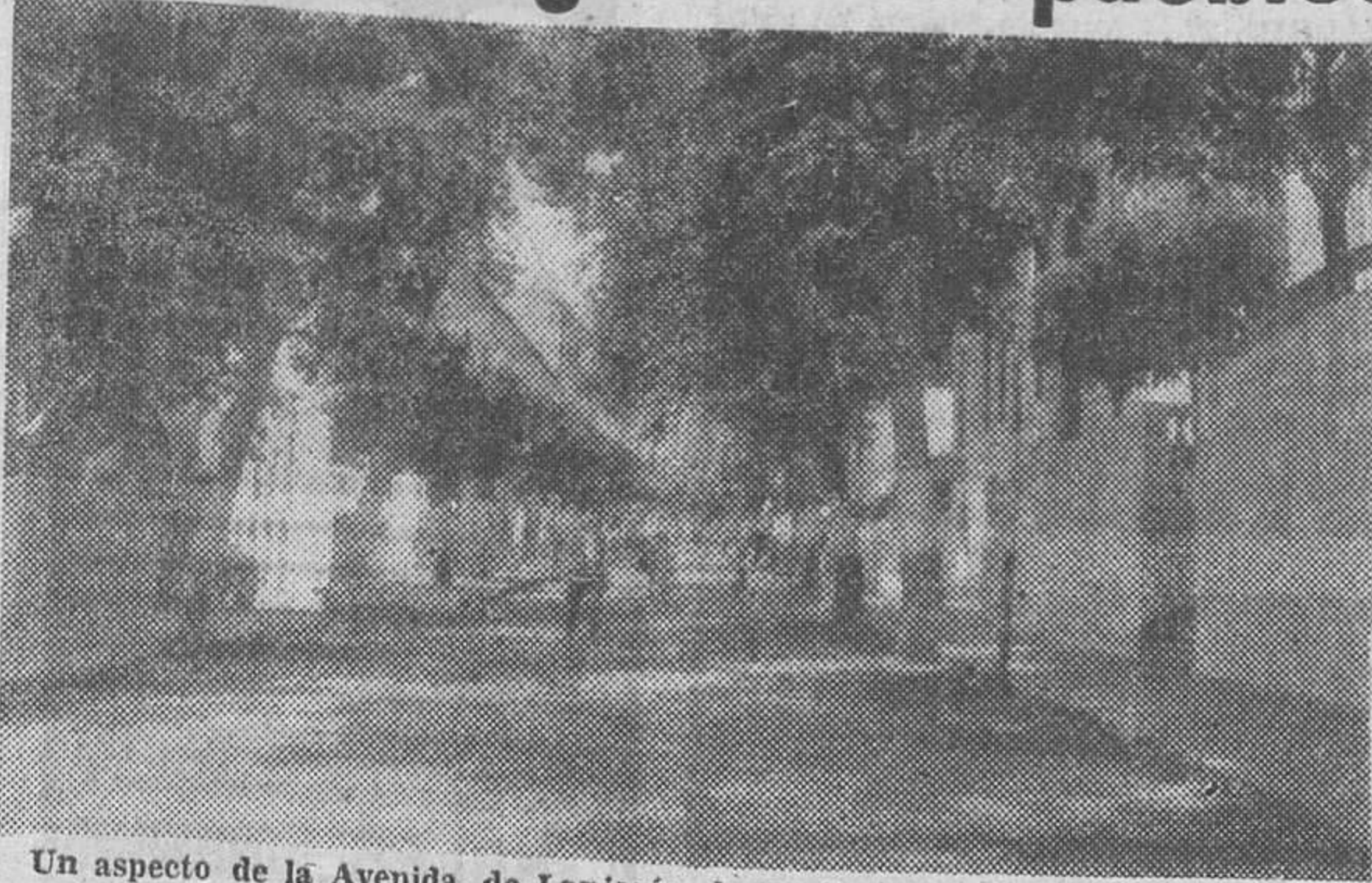
Un aspecto de la Avenida, de Lanjarón, lugar de gran afluencia de agüistas y veraneantes.

Nuestra presencia en Lanjarón ha coincidido con la celebración del homenaje anual a Sor Joaquina, la religiosa de grata memoria, que tanto bien hizo durante muchos años educando a miles de niños.