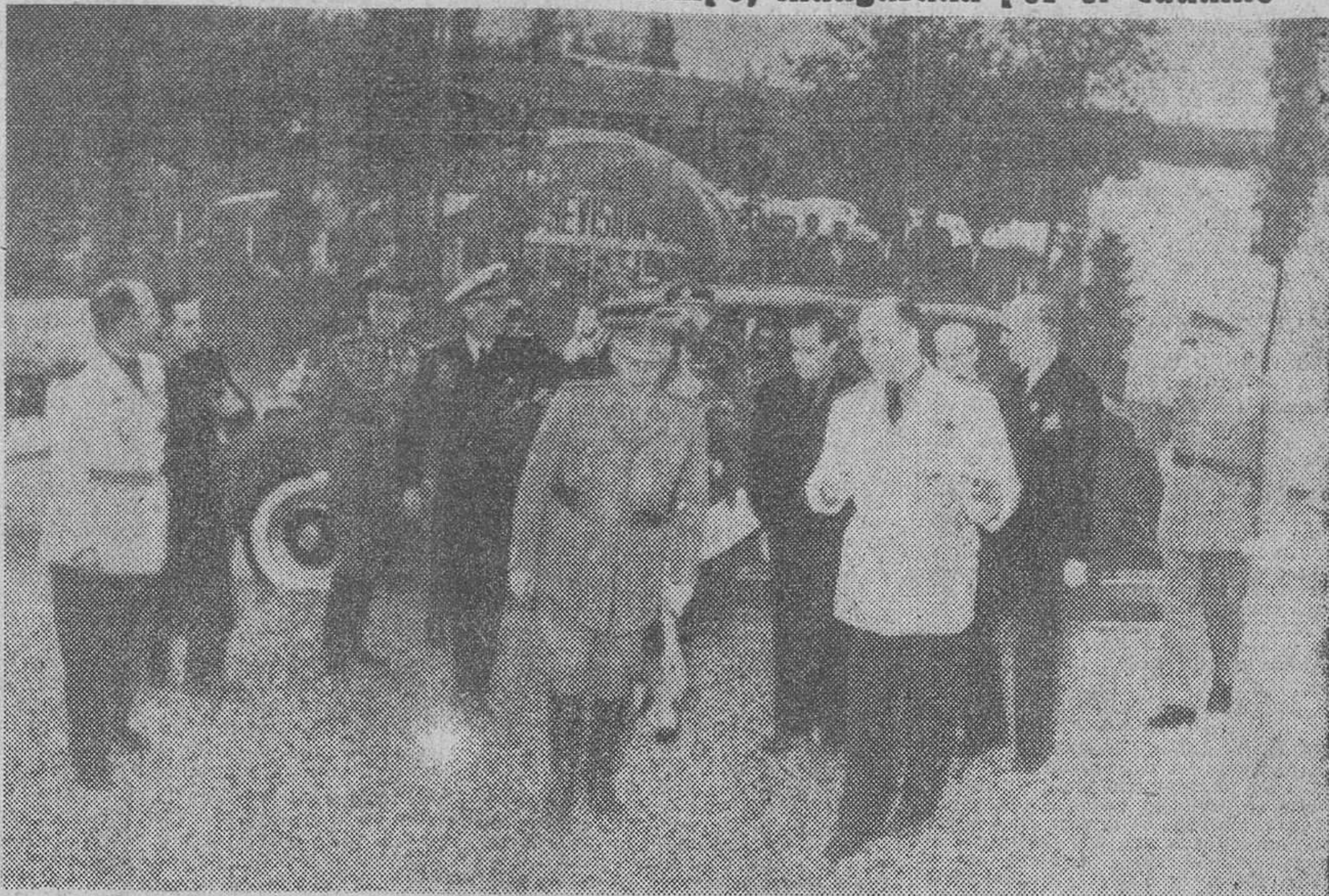
MADRID.—El martes último fué inaugurada la III Feria Internacional del Campo, a la que concurren unos cuatro mil expositores de veinte países y que permanecerá abierta durante un mes. La «foto» recoge el momento de la llegada de S. E. el Jefe del Estado al recinto de la Feria, que declaró inaugurada oficialmente. — (Reportaje sobre la Feria del Campo, en pg. 3)