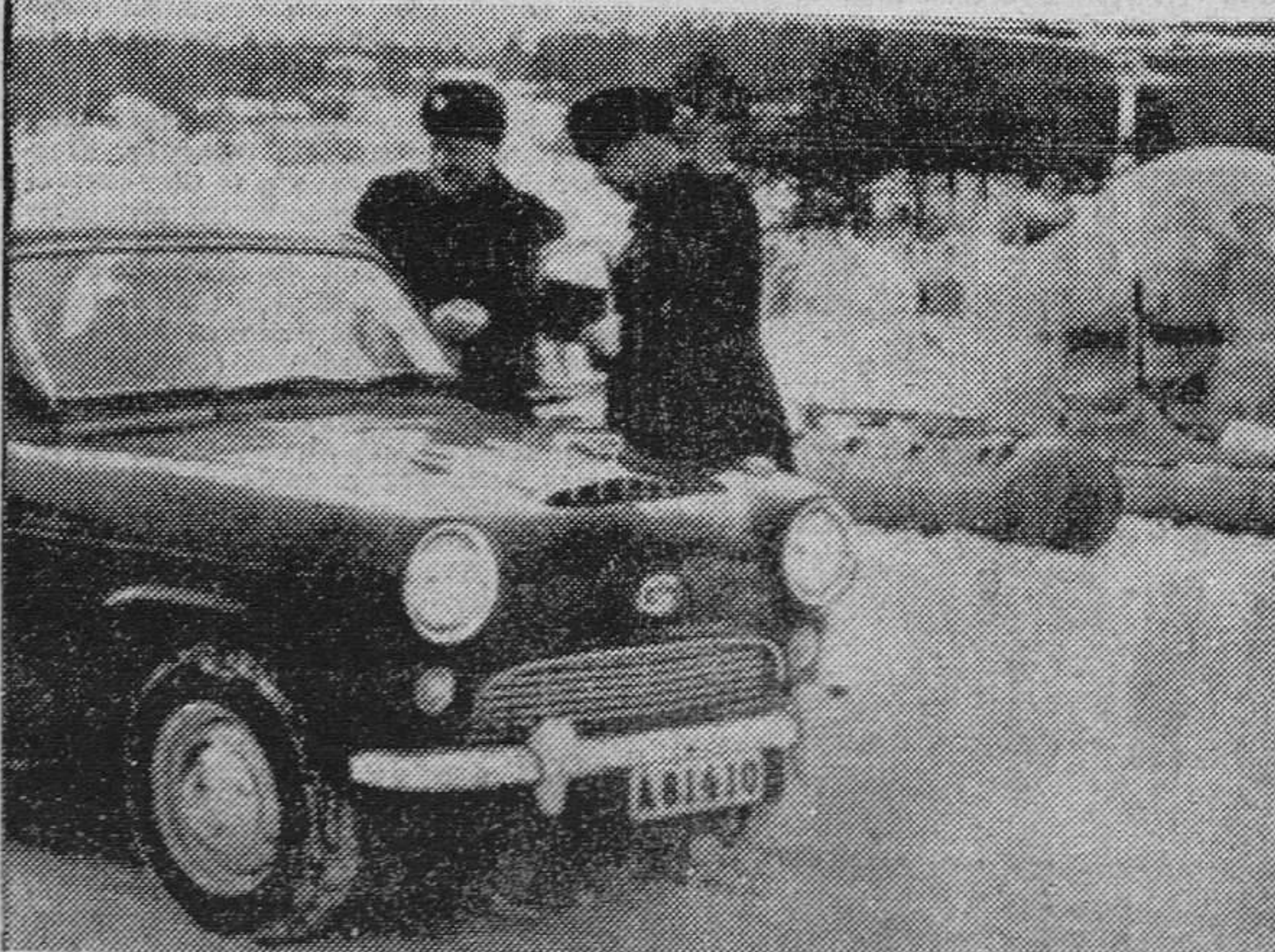
Un policía de tráfico sueco interroga a un conductor que había trasgredido las ordenanzas sobre velocidad en carretera. Los policías habían perseguido al contraventor en helicóptero, aparato que utiliza con éxito para estos fines la policía sueca.