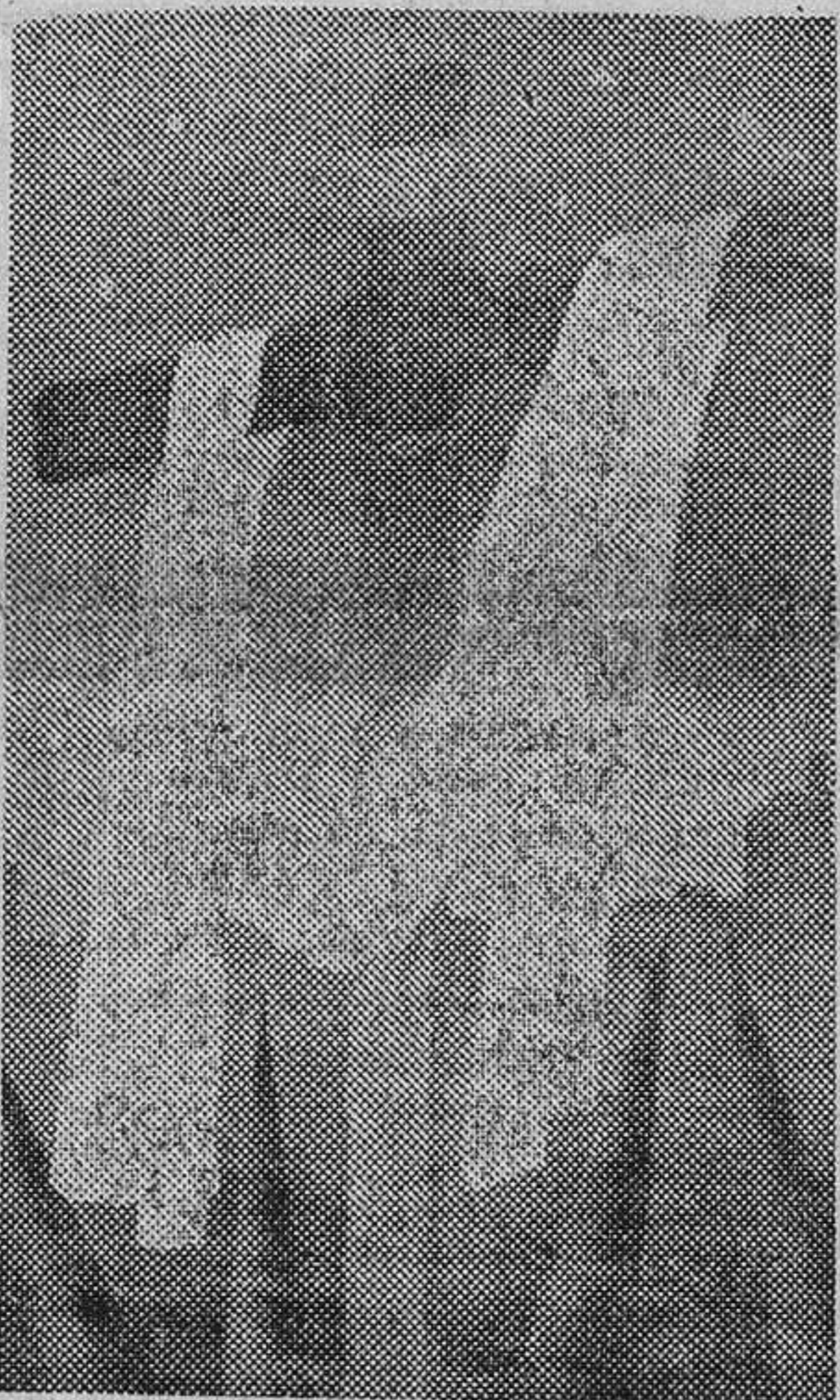
Cartel anunciador de la Semana Santa granadina, editado por la Federación de Cofradías.

La Cofradía de Nuestra Señora de la Esperanza estrenará este año un magnífico trono y un hermoso palio de terciopelo