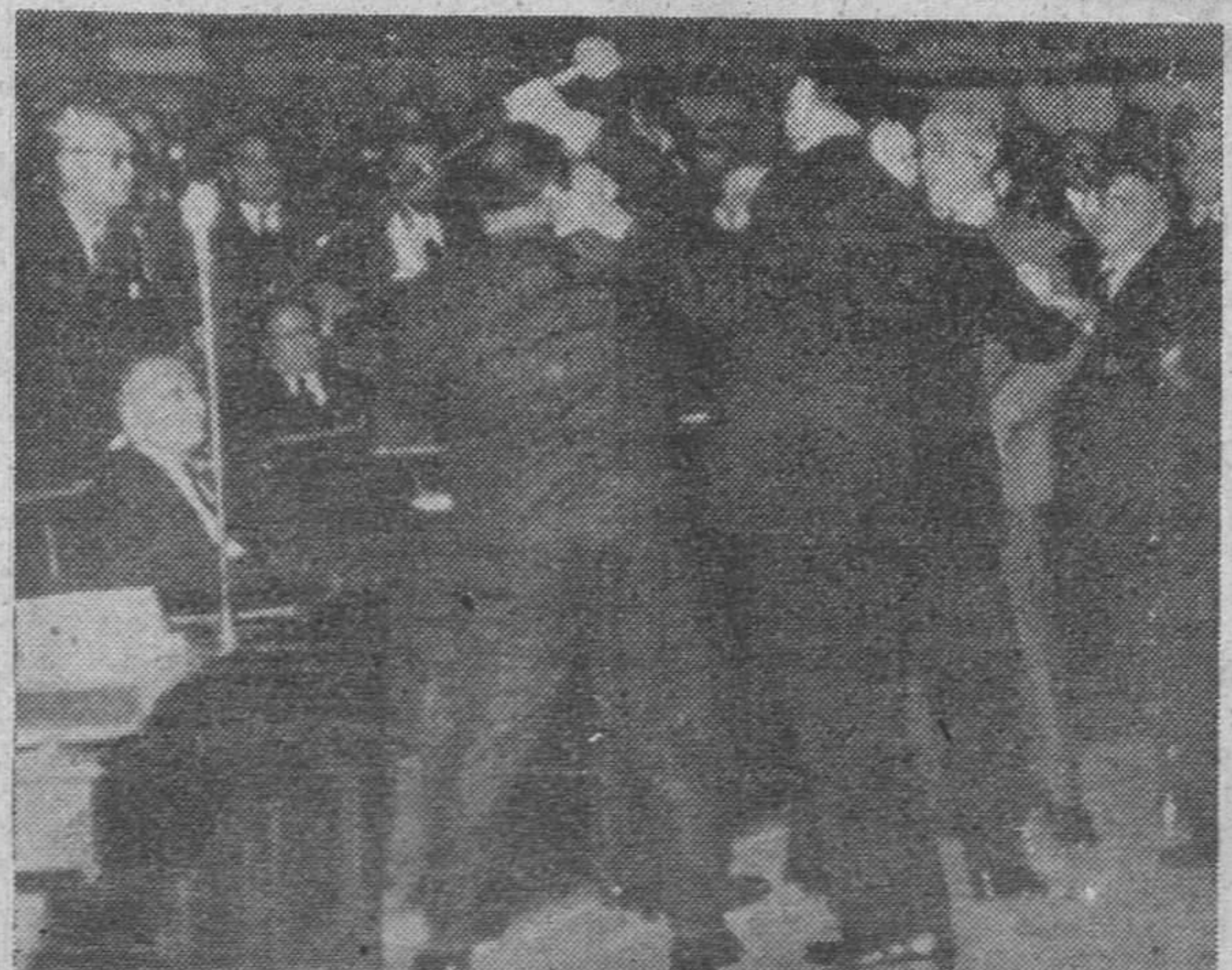
Un aspecto de los disturbios ocurridos en el Parlamento griego, durante la presentación de una moción de censura al Gobierno por los acuerdos de Londres sobre Chipre, presentada por la oposición.