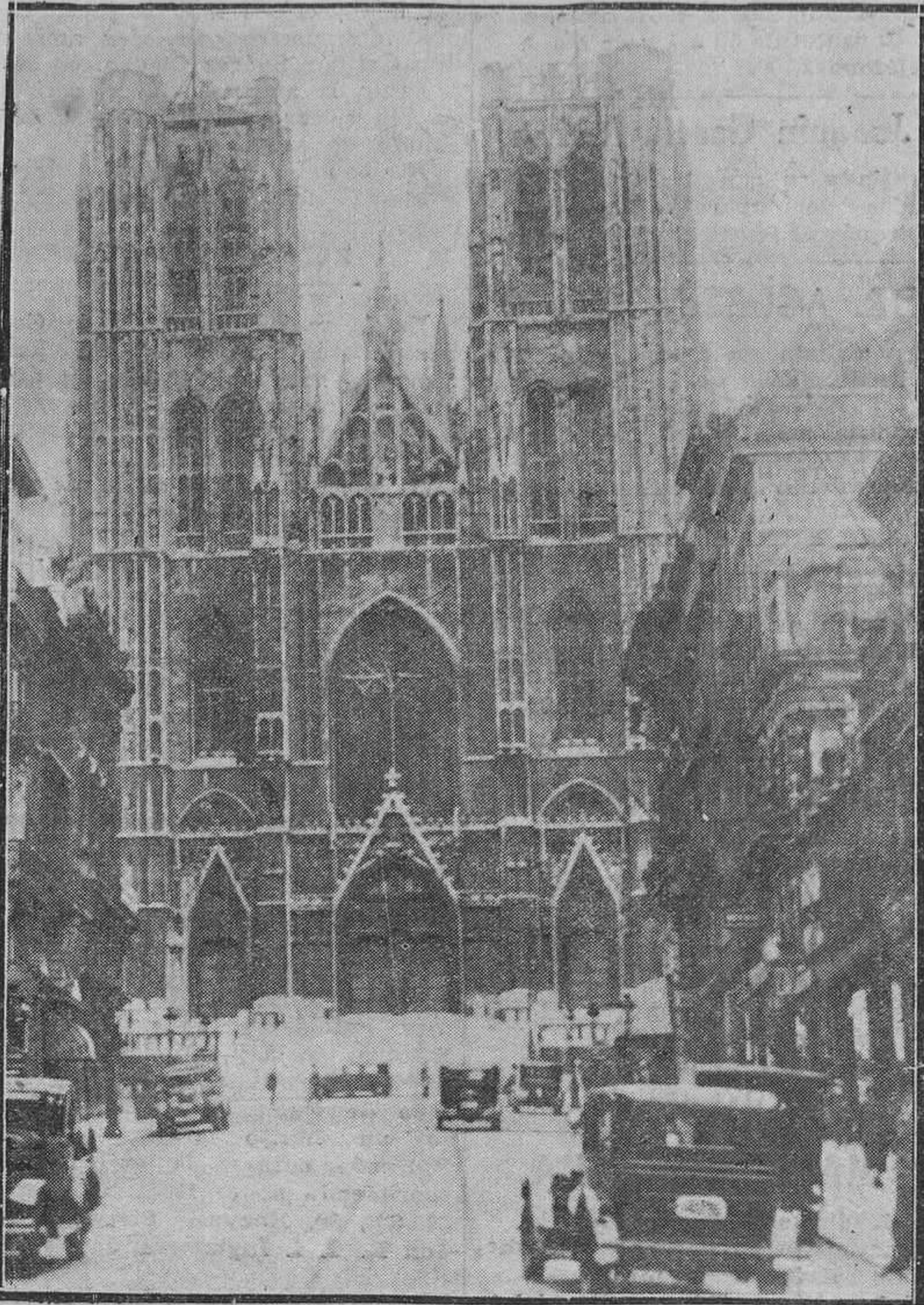
La Iglesia Catedral de Sainte Gudule, en la que se celebraron los funerales por el Rey Alberto.