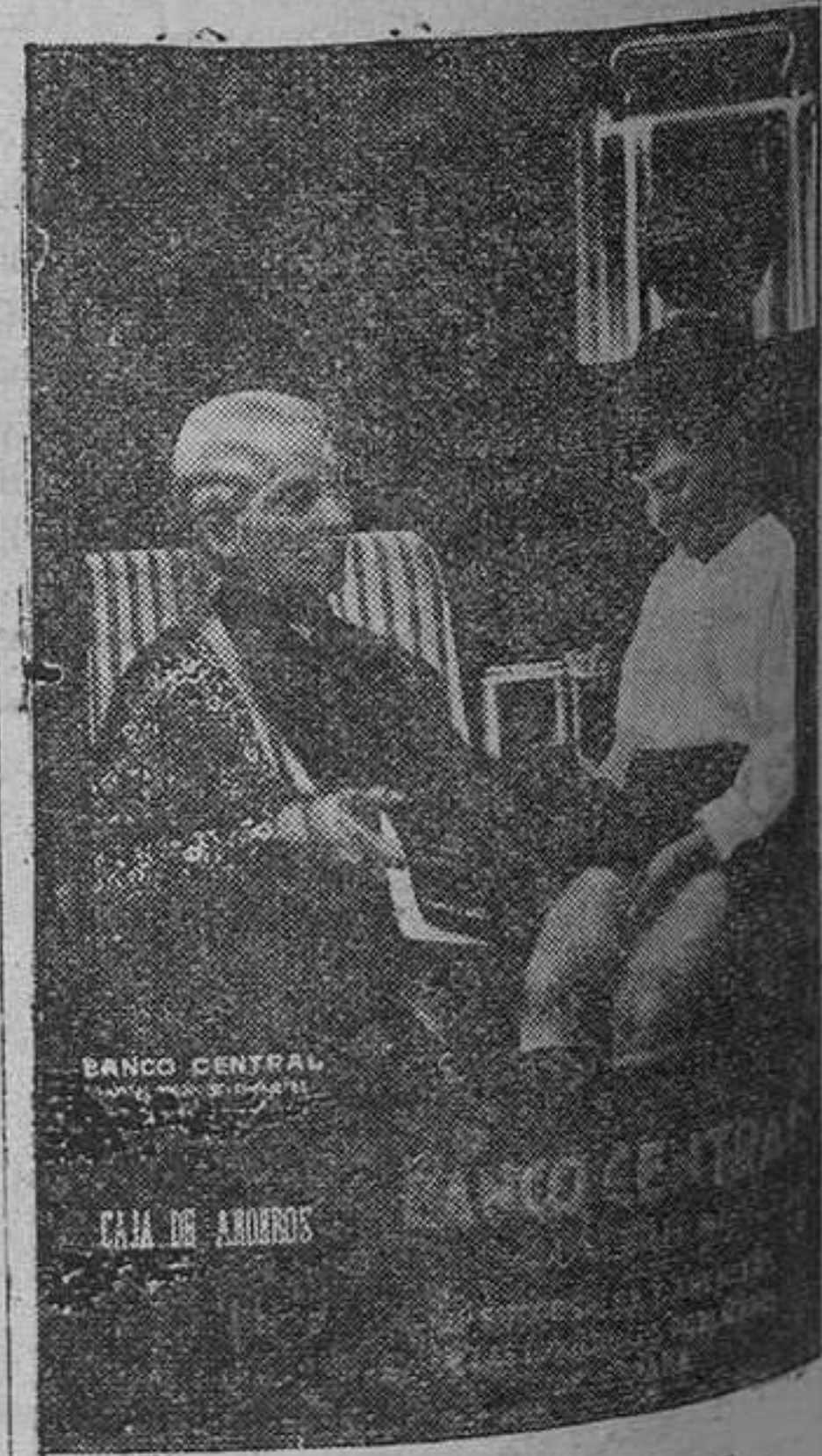
Sucursal de Oviedo: CABO NOVAL, 10