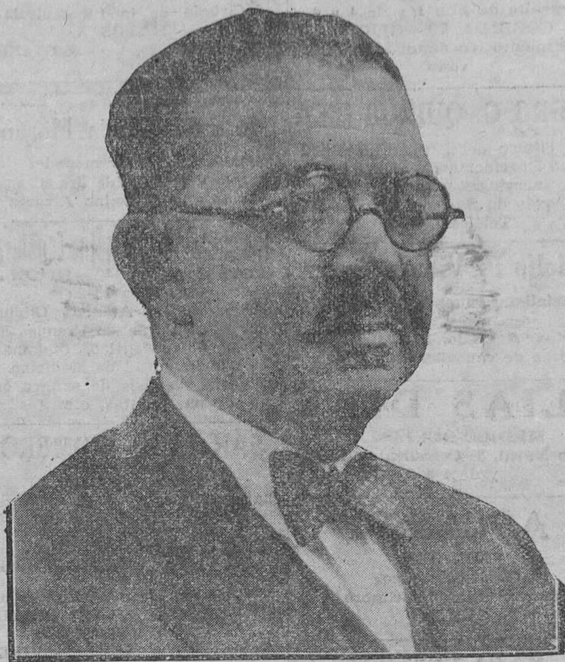
El nuevo ministro de la Guerra, D. Diego Hidalgo, diputado radical por Badajoz.