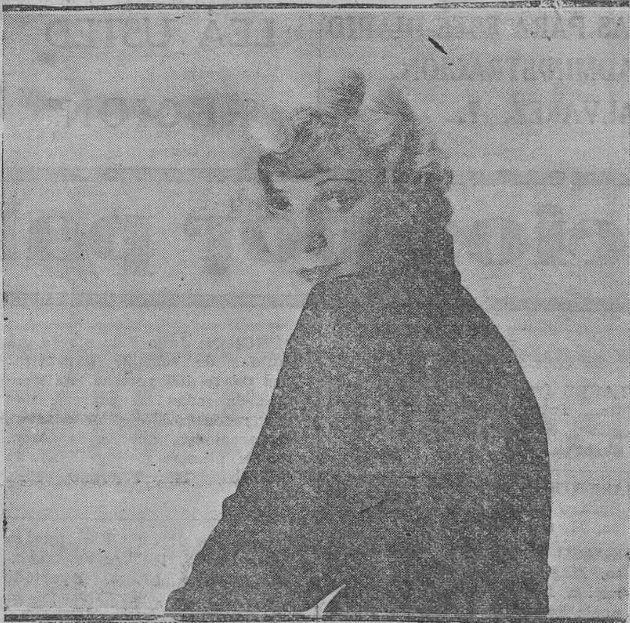
Estudio fotográfico de Isabel Jewell, encantadora actriz de la Metro Goldwyn Mayer.